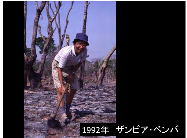
1992年 ザンビア・ベンバ