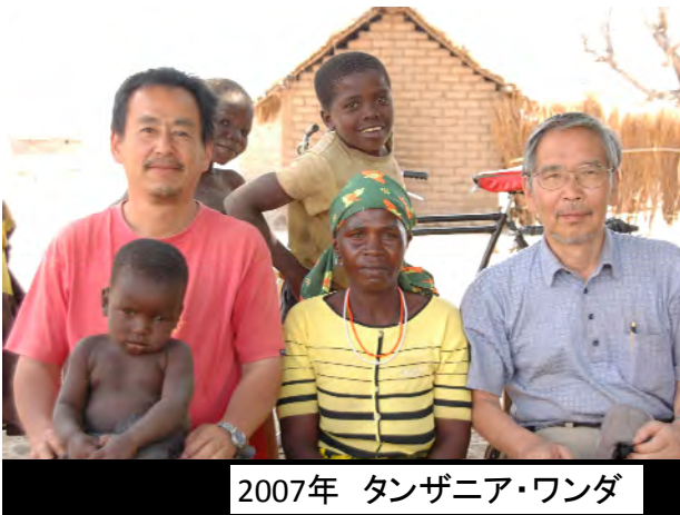
2007年 タンザニア・ワンダ