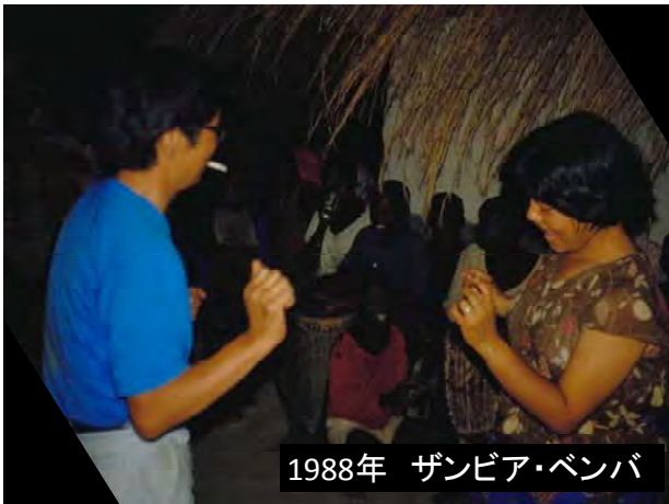
1988年 ザンビア・ベンバ