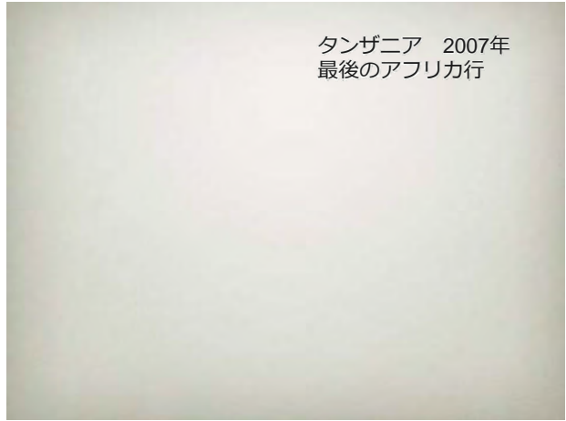
タンザニア 2007年 最後のアフリカ行