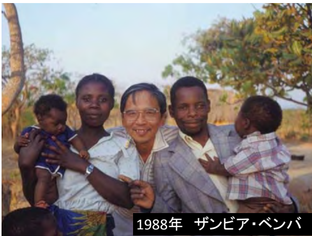
1988年 ザンビア・ベンバ