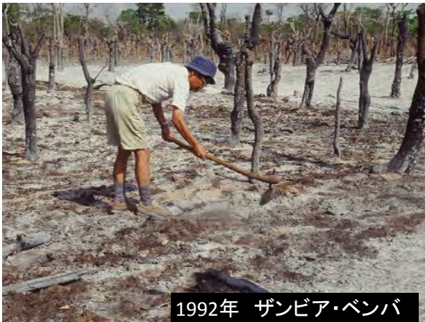
1992年 ザンビア・ベンバ