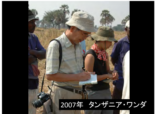
2007年 タンザニア・ワンダ