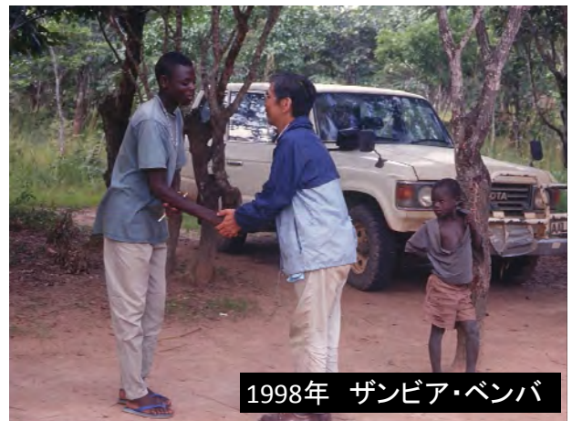
1998年 ザンビア・ベンバ