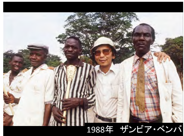
1988年 ザンビア・ベンバ