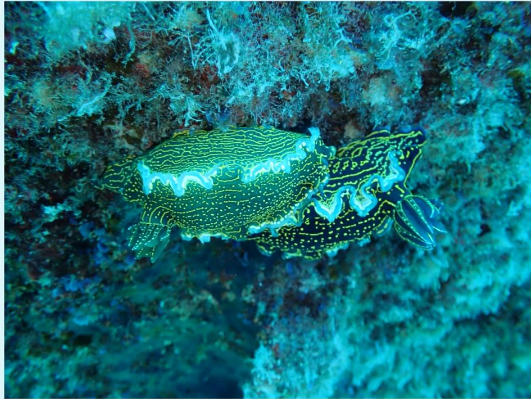
© Αριστείδου Κώστας, Felimare picta in love