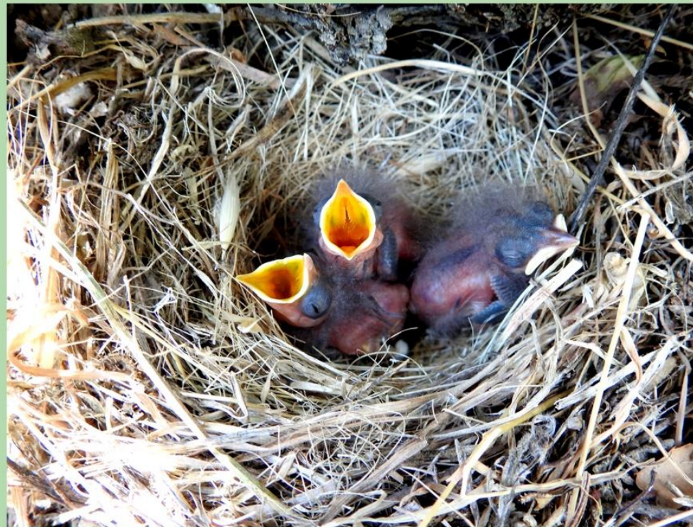
© Παρασκευά Χρίστος , Φωλιά Σκαλιφούρτα