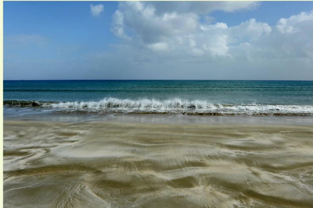
© Παναγή Αλίκη, Sculpture on the sand