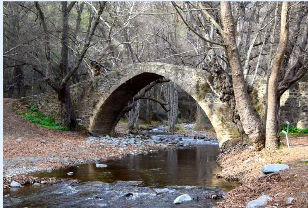
River of Tzelefos