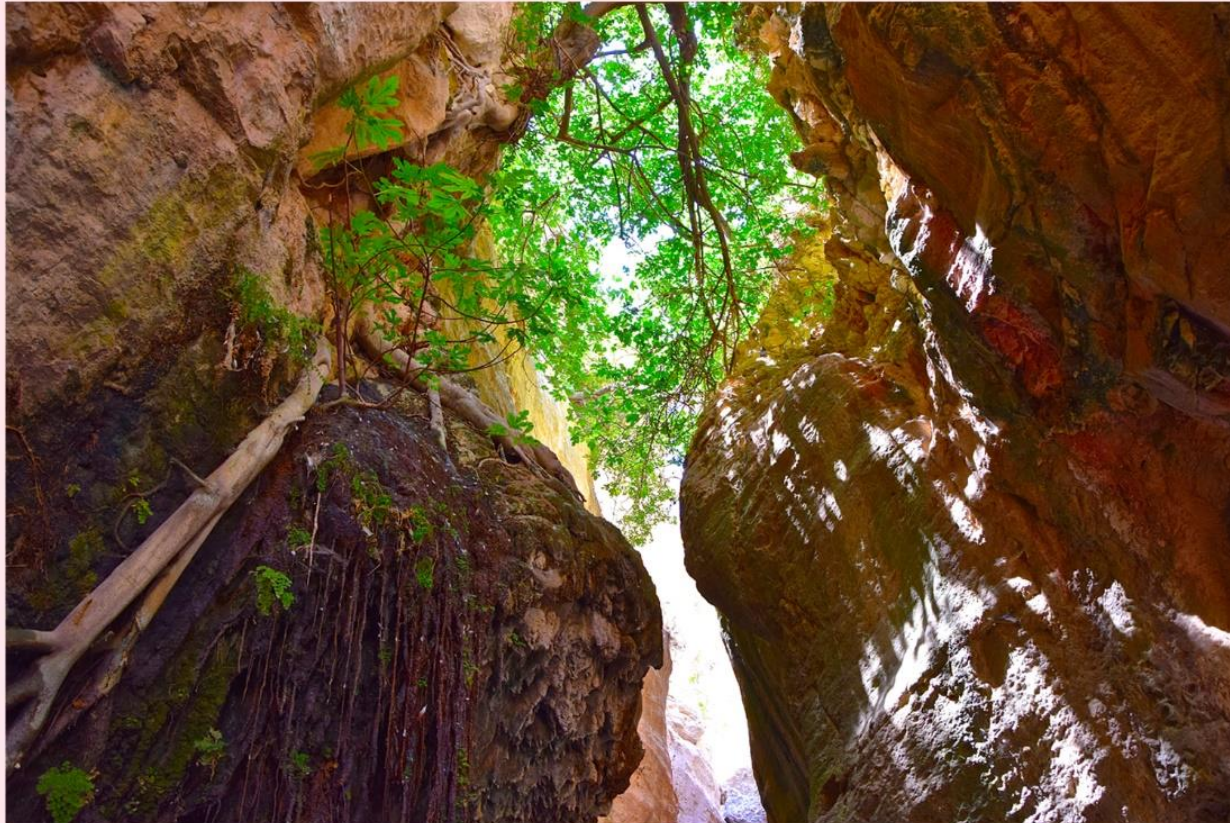
Φαράγγι του Άβακα