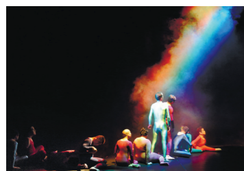
『Over the Rainbow -虹の彼方に』2013年