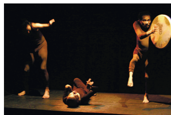
『碧天彷徨』2003年