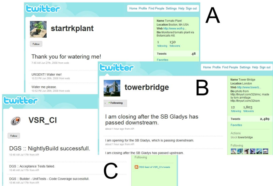
Abbildung 1: Nicht-menschliche Informationsquellen bei Twitter

Bei Transferierung dieses Gedankengangs in ein Unternehmensumfeld wird deutlich, dass potenziell zu jeder Zeit neue Spezial-Informationsanforderungen entstehen können, die durch universell verfügbare und für den Nachfrager leicht zu nutzende Microblogging-Informationen abdeckbar sind. Bestehende Forschungsarbeiten zu Microblogging in mittelgroßen Unternehmen bestätigen diesen Effekt der nichtantizipierten Informationsverwendung durch ihre öffentliche Bereitstellung (Böhringer und Richter 2009; Barnes et al. 2010). Es ist zu erwarten, dass die positiven Effekte bei einer Vergrößerung der Nutzerbasis und Integration nicht-menschlicher Microblogs nochmals deutlich steigen.