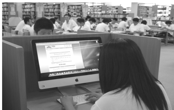
<写真2：新聞データベース「朝日けんさくくん」を使って新聞記事検索をする>

図書館での授業では、図書の探し方・データベースの利用方法について説明した上で、参考文献の書き方・本の奥付の見方も解説した。ネット情報はサイトの名称、アドレス、最後に見た日付も記入するように指導した。