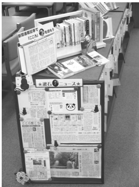
<写真3：図書館内の通年企画「夏目漱石フェア」>

2014年4月から朝日新聞の朝刊にて、夏目漱石『こころ』の連載が始まった。これにあわせて図書館内でも、連載記事を掲示するとともに、関連図書・関連新聞記事を通年企画として特集している。図書館内では、朝日新聞・読売新聞・京都新聞の三紙を購読しているものの、地方版のページに掲載されている記事を読むことはできない。そこで、「朝日けんさくくん」でキーワード検索をかけ、地方版に掲載された漱石に関連する記事を印刷し、コーナーのボードに張り出すことで、より多くの情報が生徒に目に留まるように工夫している。