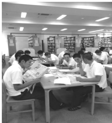
<写真1：図書資料や新聞から課題の答えを探し、ワークシートに記入していく>

は、生徒の知識が不十分すぎると感じていた。そこで、小論文の書き方を学んできたことを踏まえ、図書資料や新聞を用いて社会の現状を知り、これからどのような対策ができるか、各自で考え小論文を書かせることにした。テーマは、少子化・ネット依存等タイムリーな話題を取り上げ、白書等統計資料や辞典、関連図書、新聞記事を図書館内で探させ、ワークシートの質問事項にあわせて、調べさせた。