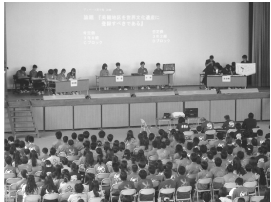
＜写真：平成26年度ディベート選手権決勝＞

ディベート選手権では日頃から図書館を利用している生徒が活躍する傾向があり、小論文対策における1年からの新聞記事読解と同様に、早いうちから図書館を利用し、情報活用について理解を深めることが重要だといえる。