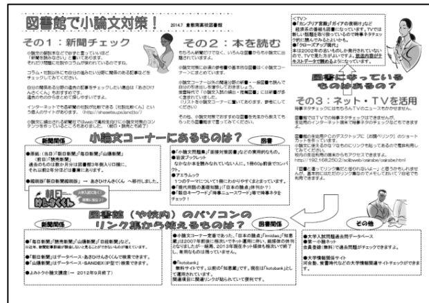
＜図3：図書館で小論文対策！＞

生徒は図書館にあるパソコンや情報教室のパソコンから、教員は職員室の自身のパソコンから利用している。閲覧場所を選ばないことも利点である。