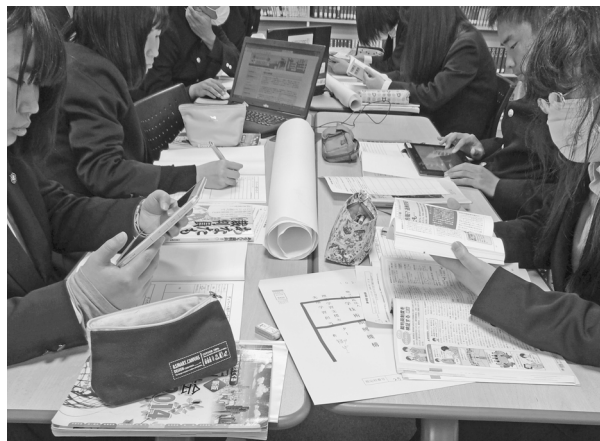
写真1 図書館での調査の様子

大統領選挙や、ここ数年大規模化しているハロウィン行事に関する情報等の記事を読み、テーマに関する知識を深め、独自の調査活動を進めることに役に立っている。