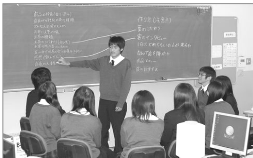
写真1 プロジェクト学習会議の様子

文部科学白書 1) には、「学校における教育環境、教育の質的向上に地域の教育力を積極的に活用する」ことの必要性に触れている。特に、本校は商業高校であることから、ビジネス面から地域活性化を目指したプロジェクト学習（以下「PBL」）に商業科目「課題研究」開講講座「パソコン演習」において取り組んでいる 2) （写真1）。