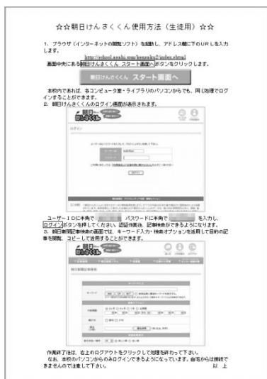
図2 「朝日けんさくくん」チラシ

「朝日けんさくくん」を活用する前段階として、誰でも簡単に操作ができることが活用の前提条件であると考え、 「朝日けんさくくん」活用チラシ を作成して、図書館利用者を中心に配付した（図2）。