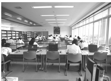
写真2 ライブラリでのPC活用の様子

本校の図書館（本校ではライブラリと称する）は、「学すべからく静なるべし」諸葛孔明の標語が掲げられ、生徒が自学自習に取り組む姿勢がこれを体現している。また、このライブラリにもノートパソコンを常設し、ライブラリ前方の席で小論文を書く生徒が調査に利用できる環境を構築している。本校のライブ