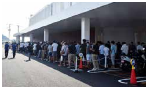
取材時の行列の様子