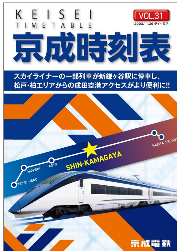
「京成時刻表VOL. 31」表紙(イメージ)