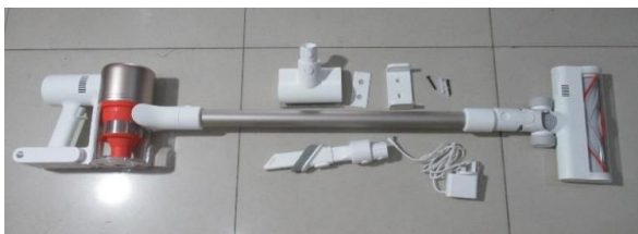
Immagine a colori del prodotto: