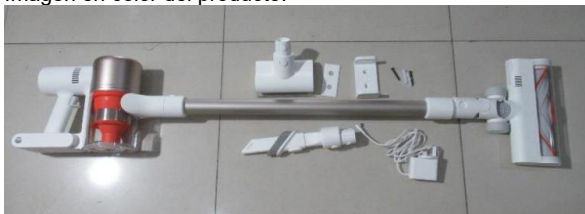
Imagen en color del producto: