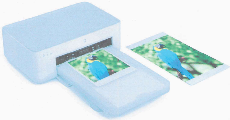
Immagine a colori del prodotto: