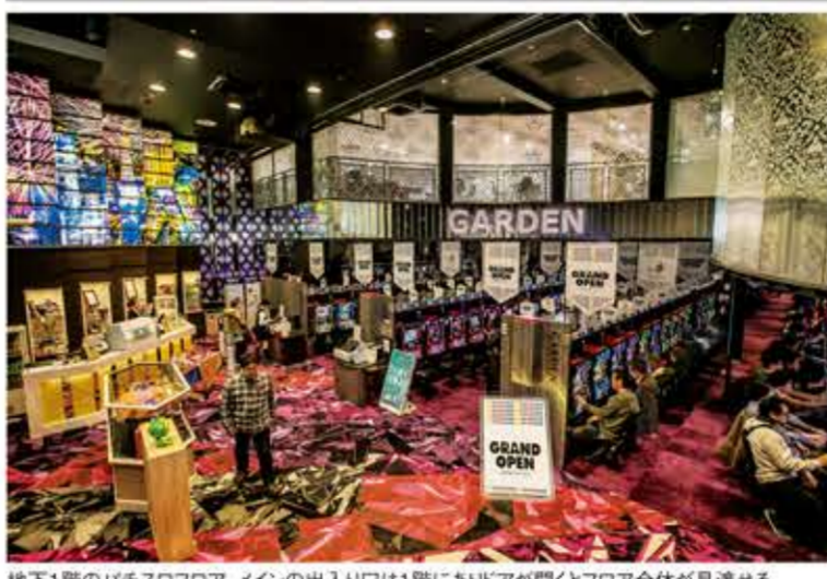
地下1階のバチスロフロア。メインの入り口は1階にあたり、フロア全体が見渡せる。

過多を感じさせないほど潤沢な人口がいる地域だ。埼玉県の有力企業は、パチンコ・パチスロのホールが多く、M&Aで屋号が変わることがあるが、ここ最近では遊技台数が大幅に増えるような新規出店がないエリアでもあり、パチンコ博物館と託児所というフロア構成だ。近隣には物流倉庫や団地などが建ち並び、夕方からは仕事を終えた多くのファンが来店する。