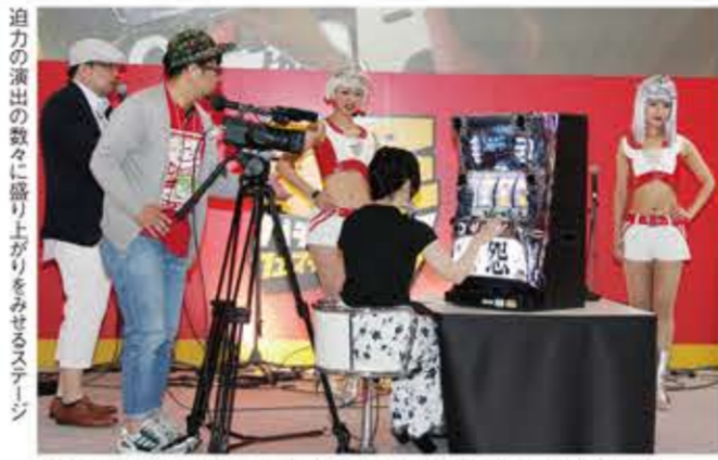
藤商事は5月8日からホール導入が始まった最新作「パチスロ 呪怨」を紹介、試打解説を行った。「パチスロ 呪怨」は、同社が誇るホラーパチスロシリーズの第2弾。2000年に発売された清水崇監督によるホラービデオ作品で、03年に劇場公開された同名映画とのタイアップ機だ。試打解説では、新感覚の3段階ART(ST+PLUS)や恐怖の「業の手役物」など注目ポイントを紹介。来場者にホラーパチスロの魅力を存分に伝えた。