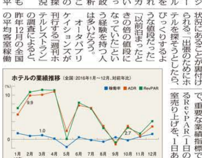
ホテルの業績推移 (全国: 2016年1月~12月、対前年比)

客室稼働率90%超えも 2016年のインバウンドは2400万人に達した。インバウンドが追い風となって、一部地域を除いて、いまホテル業界は好景を謳歌している。ホテルの稼働率も、2016年のインバウンド増加に伴って、客室稼働率が90%を超え、一部の高級ホテルでは95%を超えている。インバウンド増加に伴って、ホテル業界は好景を謳歌している。