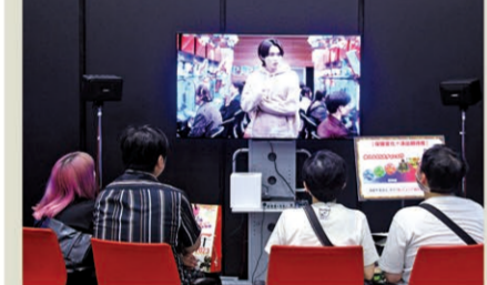
「はじめてのスマパチ」では、ホールでの遊び方もレクチャー