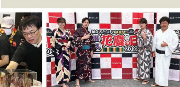
7月3日から導入されているスマパチ「花の慶次」裂一両断の稼働18台を用意した試打も大好評だった。「二刀断モード」は、大当たり連続回数をキープモードに引き上げ、プレイモードは激アツ演出を多用し、スマパチの魅力を最大限に引き出すことができた。振ってもった動画面を稼働させた。初めてのスマパチ講座には、事前申込みをした16人が参加し、1時間ずつ4回に分けてそれぞれ事前レクチャーを受けた後、「花の慶次」にも絶えず長い行列ができた。「初めてのスマパチ講座」には、事前申込みをした16人が参加し、1時間ずつ4回に分けてそれぞれ事前レクチャーを受けた後、「花の慶次」にも絶えず長い行列ができた。