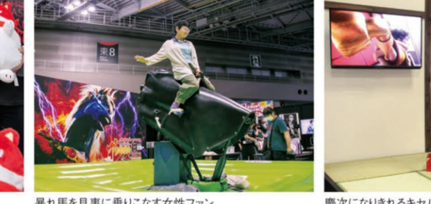
暴れ馬を見事に乗りこなす女性ファン