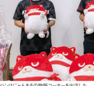
マルハンにゃんまるの物販コーナーを出店した