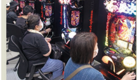
試打コーナーは常時満席だった