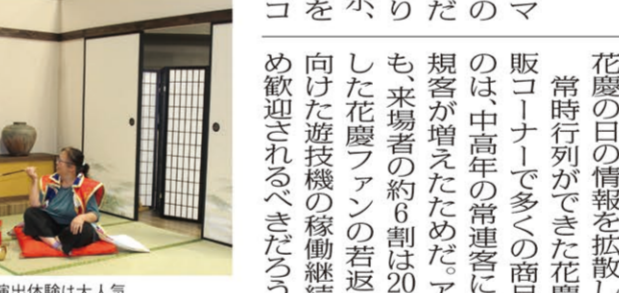
慶次になりきれキセル演出体験は大人気