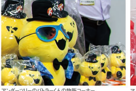
アンダーツリーのハトラくん物販コーナー