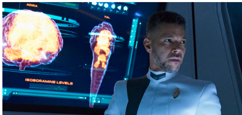
Wilson Cruz en STAR TREK: DISCOVERY