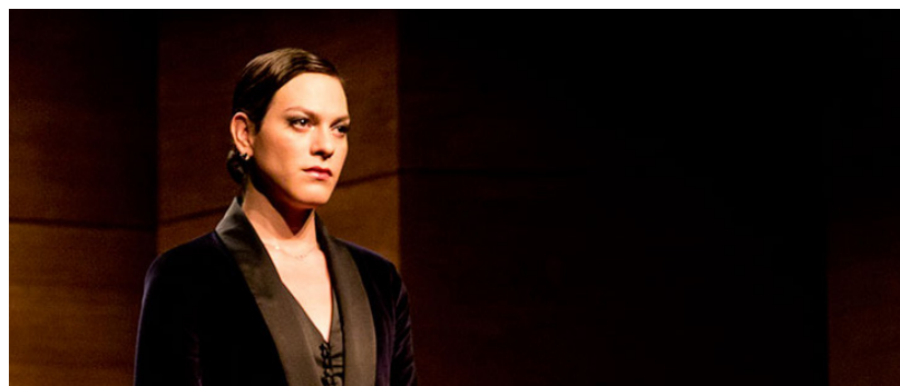
Daniela Vega en A FANTASTIC WOMAN que ganó Mejor Película Internacional en los Premios de la Academia de Artes y Ciencias Cinematográficas, entre otros premios.

¡Entonces empecemos! Y si todavía tienes alguna pregunta, siempre estamos aquí para ayudar. Puedes encontrar nuestra información de contacto en la última página de este documento.