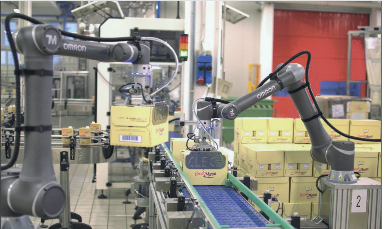
12 kg'lık yük kapasitesi ve 1300 mm'lik erişim kapasitesine sahip OMRON TM12 cobotların kullanıldığı otomasyon, şirketin hedeflerine ulaşmasını sağladı.

OMRON TM12 cobot, entegre bir görsel denetim sistemiyle donatıldı: Dahili kamera, geniş bir görüş alanındaki