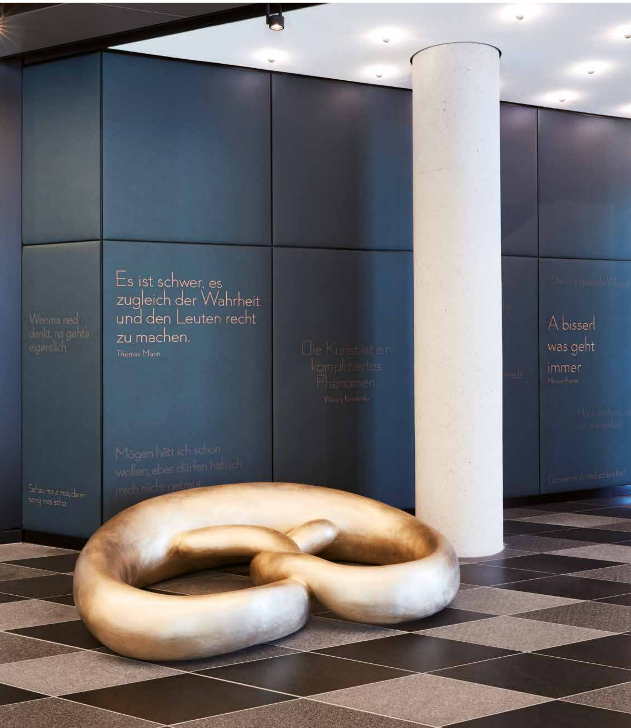
Gestickte Sprüche und eine Guss-Brezel in der Lobby zitieren die reiche Historie Schwabings. Rechts: Als Gast des Cafés „bicietta“ genießt man den Blick ins Quartier – und wahrhaft sattelfesten Sitz. Embroidered sayings and a cast pretzel in the lobby cite Schwabing's rich history. Right: As a guest of the “bicietta” café you can soak up the views of the district – a truly wonderful location.

Given that the public space in the Schwabinger Tor district should be completely dedicated to urban life, cars are kept out. Delivery and residential traffic are diverted from the Leopoldstraße into a subterranean basement, providing spaces for 700 bicycles and 900 cars. In the same way as the Andaz wants to be linked to the district in a variety of ways, the district as a whole should be a good neighbour for the Bavarian capital. In doing so, it may be regarded as pioneering for the development of district and city.