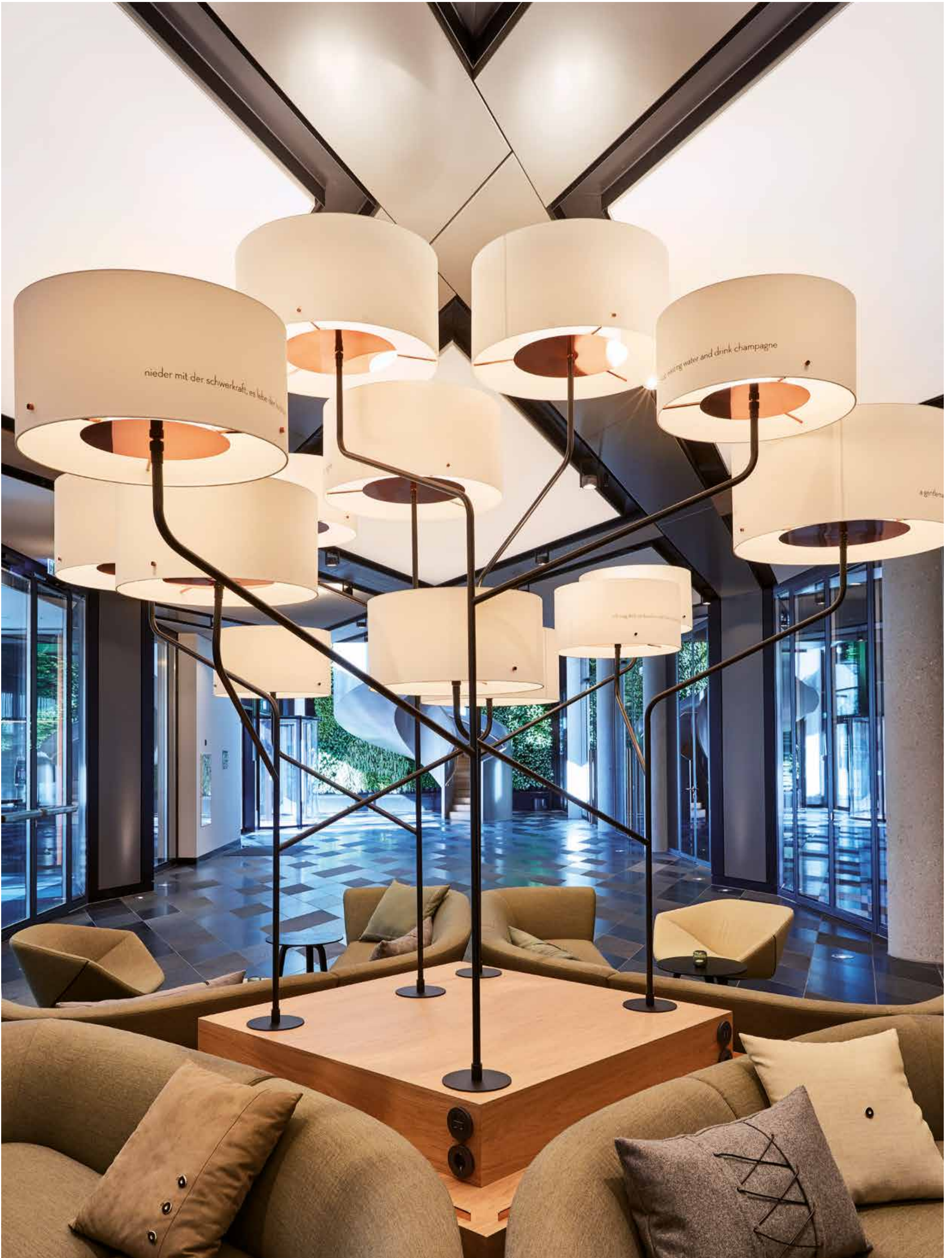
Lichtblicke in der Lobby: Das Andaz verknüpft geschickt repräsentative und gemütliche Bereiche