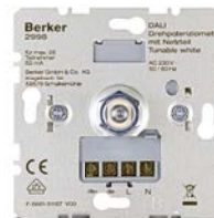
Regulador rotativo DALI, 2998 Con ajuste de brillo y temperatura de color de blanco entre 3.000 y 10.000 Kelvin. Pueden conectarse hasta 26 dispositivos DALI.