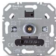
Regulador rotativo universal (R, L, C, LED), 2973 Carga incandescente: 20–210 W/VA Para LED de 3–60 W (sin transformador), 20–60 W (sin transformador)