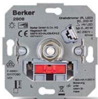
Regulador rotativo (R, LED) 2909 Carga incandescente: 20–200 W Para LED de 3 a 40 W