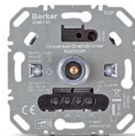
Regulador rotativo universal confort (R, L, C, LED), 296110 Carga incandescente: 20–420 W/VA Para LED de 3–100 W con hasta 3 extensiones (296210). (neutro necesario)