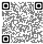
公立小学校の事例