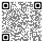
公立中学校の事例