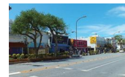
コザのゲート通り