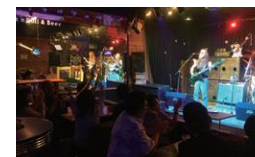
オキナワンロック

「エイサー」は、本土の盆踊りにあたる沖縄の伝統芸能のひとつ。6月から9月までは、エイサーシーズンとなっており、主に沖縄の各地域の青年会が旧盆の夜に地域内を踊りながら練り歩きます(道ジュネー)。本島中部は、最も「エイサー」が盛んな地域と言われ、毎年、旧盆が近づくと沖縄市の各公民館からドンドンと太鼓を打つ音が聞こえてきます。エイサーのまち沖縄市では、毎年、旧盆の翌週末に、沖縄最大のイベント「沖縄全島エイサーまつり」が沖縄市コザで開催され、沖縄県内各地域のエイサーが披露されます。