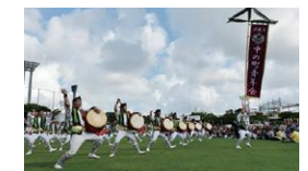
沖縄全島エイサーまつり