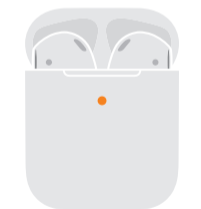
Not fully charged Не повністю заряджено