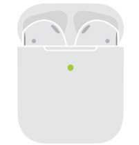
Fully charged Повністю заряджено

Двічі торкніть AirPods, щоб відтворити або перейти вперед. Промовте «Hey Siri» (Привіт, Siri!), щоб виконати такі дії, як відтворення пісні, здійснення виклику або отримання маршрутів.