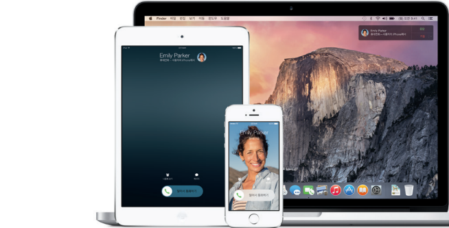
*iOS 8이 실행 중인 장비가 필요합니다. Mac과 iOS 장비를 동일한 iCloud 계정으로 로그인해야 합니다.