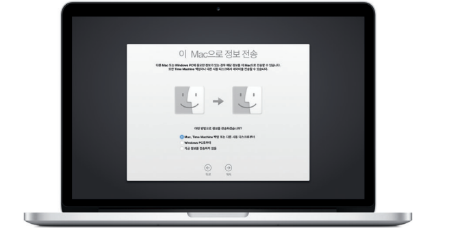
파일을 새로운 Mac에 전송하는 방법을 배우려면 support.apple.com/kr/HT6408?viewlocale=ko_KR 사이트로 이동하십시오.

설정 지원에서 Apple ID로 로그인하십시오. 로그인하면 Mac App Store, iTunes Store 및 메시징나 FaceTime과 같은 App에서 계정이 설정되므로 처음 열면 바로 사용할 수 있습니다. iCloud도 설정되므로 Mail, 연락처, 캘린더 및 Safari와 같은 App에 사용자의 최신 정보가 설정됩니다. Apple ID가 없는 경우 설정 지원에서 생성하십시오.