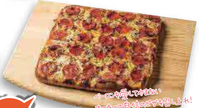
シチリア風ピザ (ベーコンとペパロニ)

肉料理を中心に前菜からデザートまで珠玉のメニューが揃う。ワイン、カクテル等ドリンクメニューも幅広く、様々なマリナーージュが楽しめる。 ⑧沖縄市中央4-1-1 ☎098-989-8238 ⑨ランチ11:30~14:00 ディナー17:00~23:00(土曜~24:00) ⑩火、第一水 ⑪なし ⑫P33 C-2