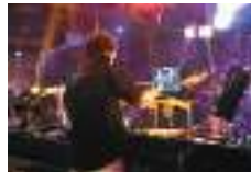
ベテランDJの選曲によりお客さん同士の一体感が生まれる

ココがISSA推し 幅広い年代の方に楽しんでもらえるサウンドを提供してくれるクラブ!