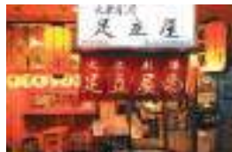
中央パークアベニュー通り沿い。ボトルは隣の系列店の酒屋でどうぞ