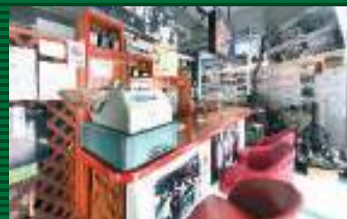
Aサインパーのカウンターを再現したコーナー。レトロなレジスターやカウンターチェアが当時を蘇らせる