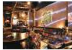
バーラウンジはターンテーブルやダーツなどもある賑やかな空間