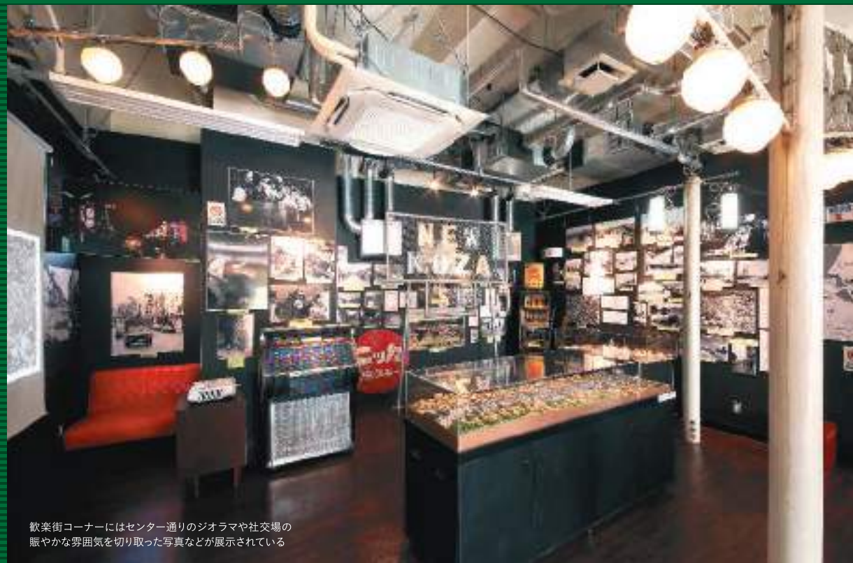
歓楽街コーナーにはセンター通りのジオラマや社交場の賑やかな雰囲気を感じ取った写真などが展示されている