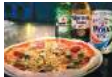
人気のオリジナルピザ1000円。ドリンク各種500円