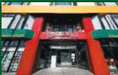
ゲート通りでひと際目を引く外観。ヒストリーの頭文字「H」を真っ赤に模り、黄色や緑で組み合わせた配色が印象的