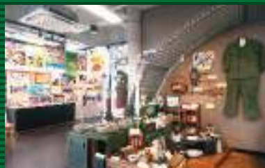
戦後の沖縄で使用された生活用具展示コーナー。食器や家電、道具など当時の生活空間が広がっている