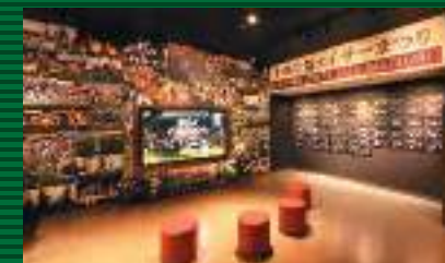
県下最大のエイサーイベント「沖縄全島エイサーまつり」の過去からの映像を大型モニターで鑑賞することができる

⑧沖縄市上地1-1-1(コザ・ミュージックタウン内) ☎098-989-5066 ⑨10:00~21:00 ⑩水曜(休日の場合はその翌平日)、年末年始 ⑪一般300円(団体250円)・小中高生100円(団体80円)・小学生未満無料 ⑫コザミュージックタウン内有料駐車場 エイサー会館1F(無料ゾーン) 観覧の方1時間無料 2F(有料ゾーン) 観覧の方3時間無料 ⑬P33 B-3