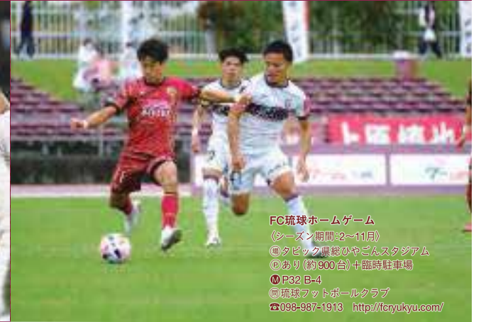
FC琉球ホームゲーム (シーズン期間:2~11月) ◎タピック県総合運動公園スタジアム ◎あり(約900台)+臨時駐車場 ◎P32 B-4 ◎琉球フットボールクラブ ☎098-987-1913 http://fcryukyu.com/

FC琉球は2010年度より沖縄市をホームタウンとし、2020年で10周年を迎えました。ホームスタジアムは沖縄県総合運動公園陸上競技場であるタピック県総合運動公園スタジアム。チームの理念として「沖縄を愛し、沖縄に愛される～地域密着を超える地域愛着を目指す～」という想いを掲げ、ホームタウン活動が活発に行われています。