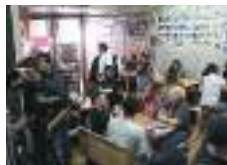
TVや映画にも起用されるほどロケーション的にも味わいがある

沖縄のお袋の味とボリューム満点なメニューが自慢の老舗の大衆食堂。味の変化を楽しんでほしいと、オリジナルソースも用意。創業当時から地元客はもろろんのこと、外国人の胃袋を掴んで離さない。