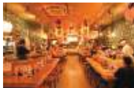
各カウンター上には料理のジャンルで別れた赤ちょうちんがぶら下がる