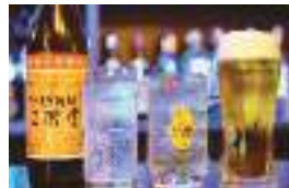
メニューは生ビール、泡盛、焼酎、ハイボールなどお酒中心。(500円~)