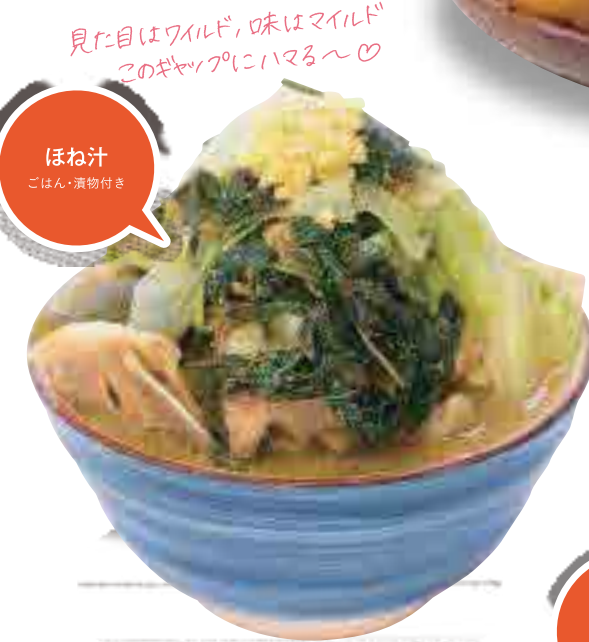
ほね汁 ごはん・漬物付き

昔ながらのあたたかみとノスタルジックな雰囲気や今に残す。「かつB」の愛称で親しまれている「とんかつ定食B」はコザの隠れた名物。 ⑧沖縄市中央1-27-23 ☎098-938-3960 ⑨11:00~23:00(L.O. 22:30) ⑩水 ⑪なし ⑫P33 B-2