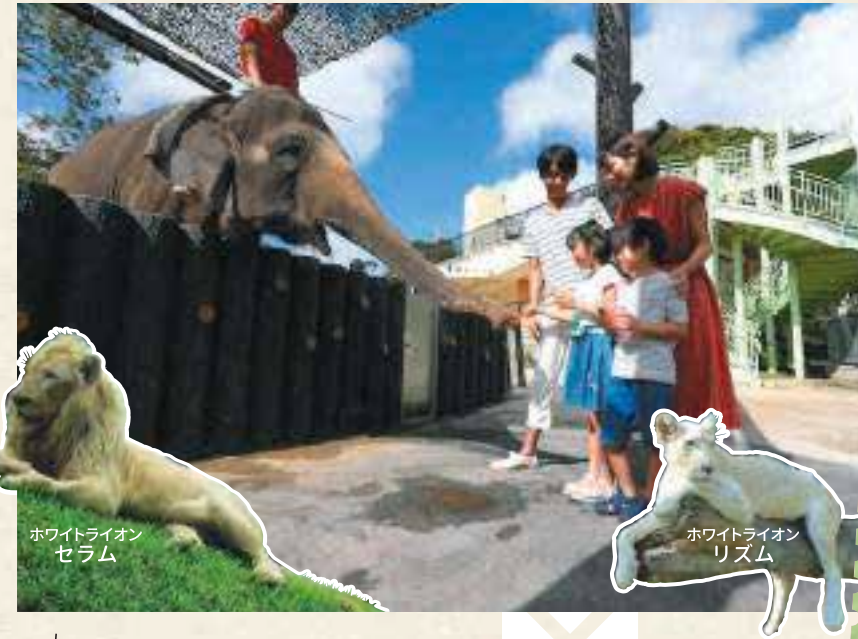
ホワイトライオン セラム

テーマは「癒し・健康」。地元食材満載のビュッフェは、大人も子どもも大満足の豊富なメニュー。植物園を見渡すロケーションも最高。