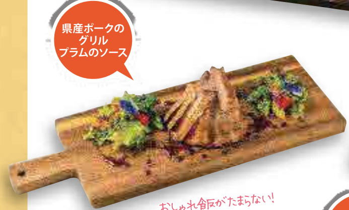
県産ポークの グリル プラムのソース

ペルー料理・炭火焼ローストチキン(ボジョ・ア・ラ・ブラサ)の専門店。自慢のローストチキンは香ばしくジューシー。ウェブ注文なら1,350円とお得! ⑧沖縄市中央1-11-5 ☎098-989-1455 ⑨16:00~21:00 ⑩月・火 ⑪なし ⑫P33 B-3