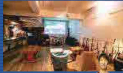
Crossover Café 614

Vリーグシーズン (シーズン期間: 10月中旬～3月末) ◎沖縄市体育館 ◎P32 B-4 ◎パナソニックパンサーズ ◎https://panasonic.co.jp/sports/volleyball/