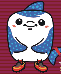
オフィシャルマスコット ジンペーニョ