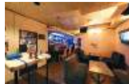
店内にはターンテーブルもあり、DJイベントなども定期的にお酒中心。