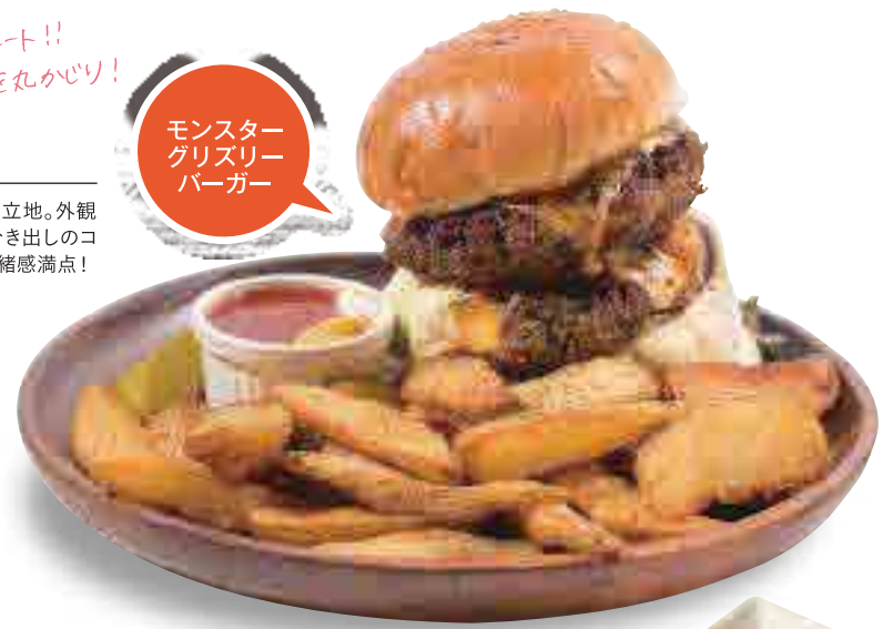
モンスター グリズリー バーガー

30年以上の歴史を誇る老舗タコス店。外はバリバリ、中はモチモチな独特食感の特製シェルが人気の秘密。インチラータやブリート等、本格的なメキシコ料理も◎。 ⑧沖縄市久保田3-1-6 プラザハウスショッピングセンター1F ☎098-933-9694 ⑨10:00~22:00 ⑩無休 ⑪あり ⑫P32 A-4