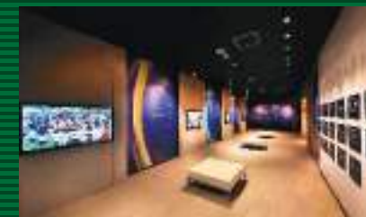
エイサーの歴史をはじめ、沖縄市内の各青年会のエイサーや国内外に広がる創作エイサーなどが紹介されている