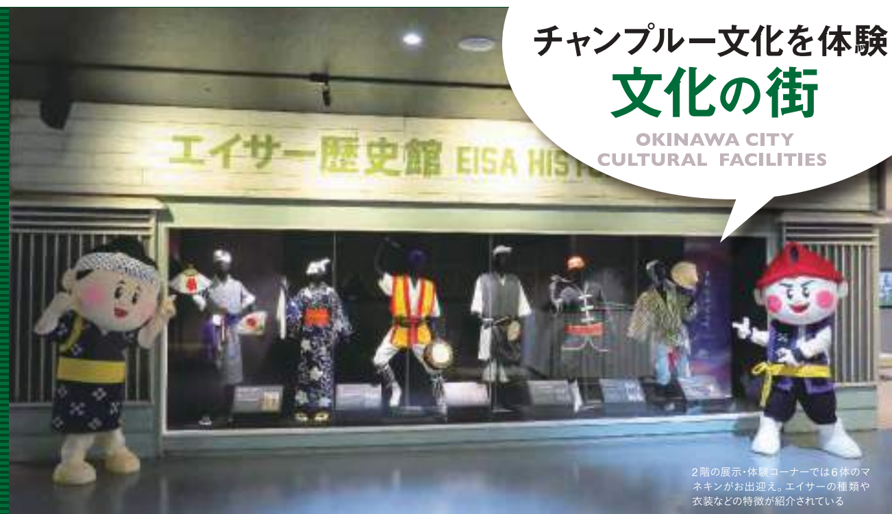
2階の展示・体験コーナーでは6体のマネキンがお出迎え。エイサーの種類や衣装などの特徴が紹介されている