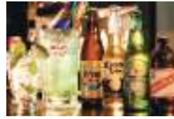
モヒート800円やトラシュカン1500円、コロナ600円などお酒が充実