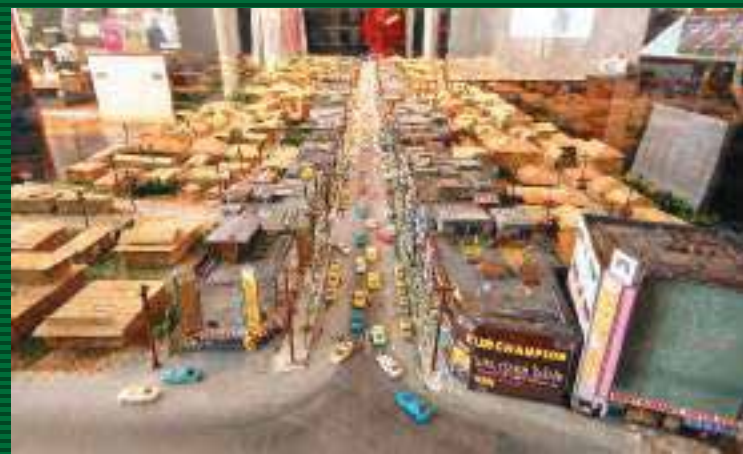
1970年代のセンター通り(現在のパークアベニュー通り)の街並みを正確に再現した模型(ジオラマ)

⑧沖縄市中央2-2-1タサビル1F・2F ☎098-929-2922 ⑨10:00~18:00 ⑩月曜・祝祭日・慰霊の日・年末年始 ⑪入場無料 ⑫あり ⑬P33 B-2