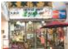
中央パークアベニューの入口近くにある大きな看板が目印