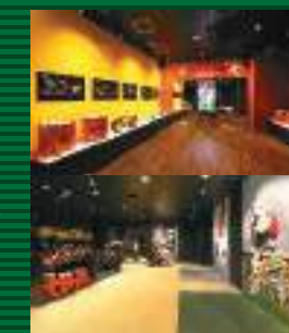
太鼓を叩いて踊ったり、衣装を着て写真がとれる体験コーナーの他、エイサーの音楽を調べて聴くことができる