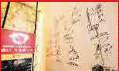
鉄板居酒屋 & 広島お好み焼き 赤いへるめっと

広島のお好み焼きが楽しめる鉄板居酒屋。カープの選手もキャンプ時に訪れた事もある。ファンにはたまらないお店！