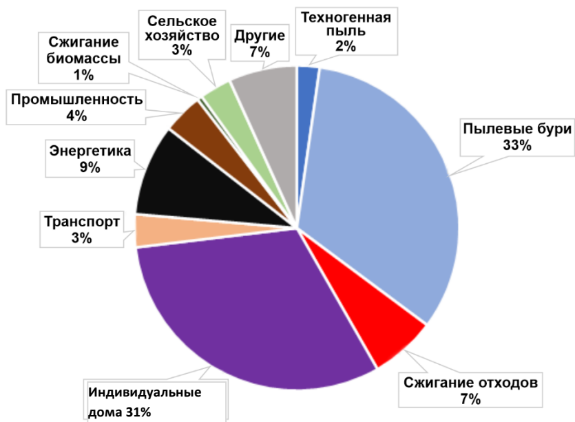
Иллюстрация 2: Распределение источников загрязнения и формирования среднегодовой концентрации PM_{2.5} в г. Душанбе