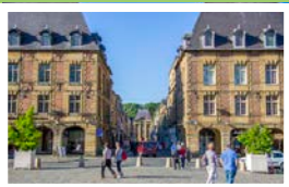
Place Ducale (FR)