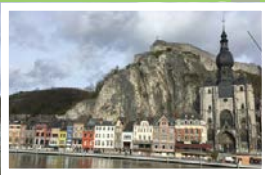
Collégiale Notre Dame (BE)