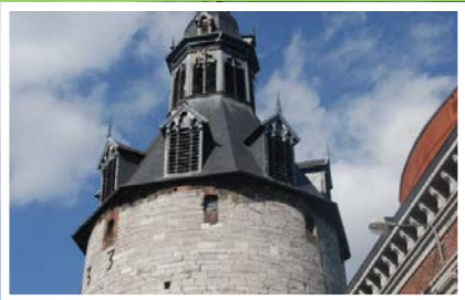
Beffroi de Namur (BE)