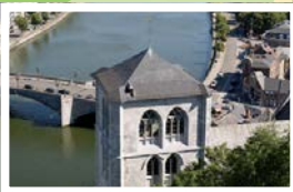
Fort de Huy (BE)