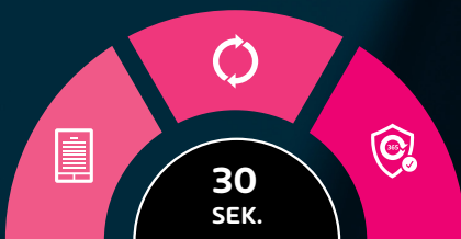
Abb.: Einfacher Onboarding-Prozess in drei Schritten

Mit 365 Total Protection schöpfen Sie das volle Potenzial Ihrer Microsoft Cloud Dienste aus.