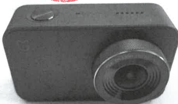
Imagem a cores do produto: