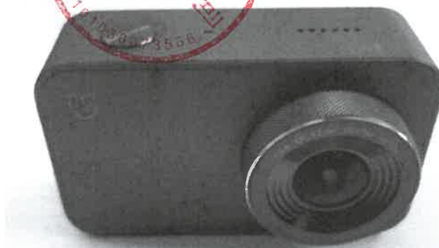
Imagen en color del producto:

Nombre, cargo: Beng Pan Quality Supervisor