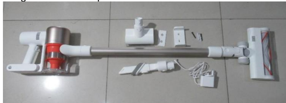
Imagen en color del producto: