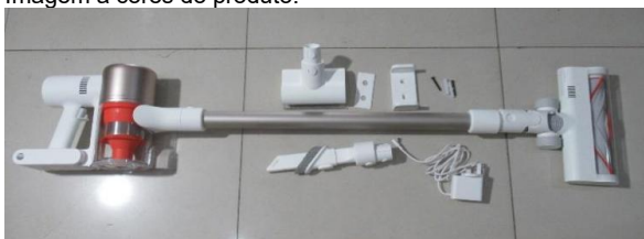
Imagem a cores do produto: