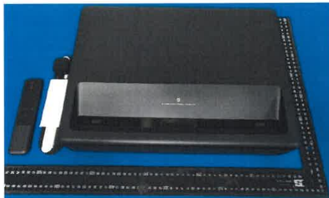
Imagen en color del producto: