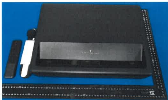
Immagine a colori del prodotto: