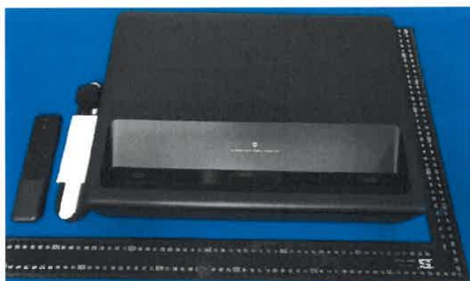
Imagem a cores do produto: