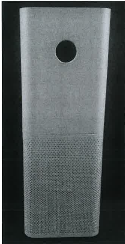
Immagine a colori del prodotto: