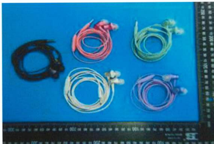
Imagem a cores do produto: