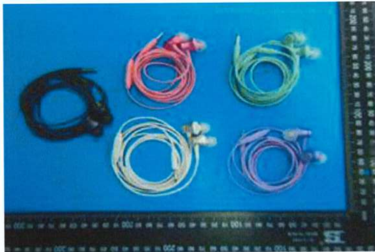
Immagine a colori del prodotto: