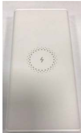
Immagine a colori del prodotto: