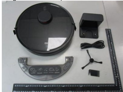
Imagen en color del producto: