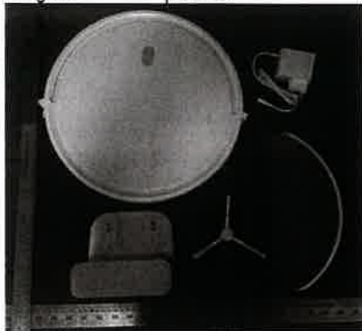
Imagem a cores do produto: