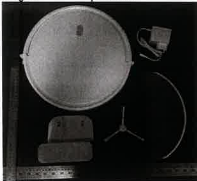
Imagen en color del producto:

Nombre, cargo: Gary Xu / Compliance Engineer