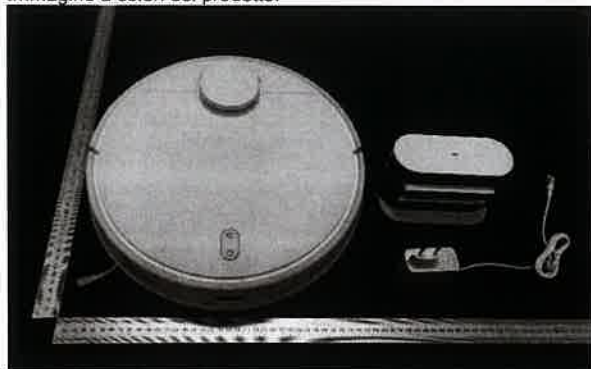
Immagine a colori del prodotto:

Xiaomi Communications Co., Ltd. #019, 9th Floor, building 6, 33 Xi'erqi Middle Road, Haidian District, Beijing, China, 100085