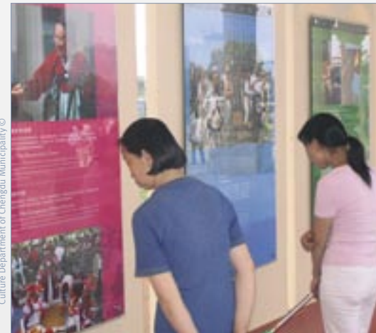
زوار معرض الصور: «التراث الحي: في اكتشاف غير المادي»

بعد باريس (فرنسا) وأبوظبي (الإمارات العربية المتحدة)، حط المعرض الفوتوغرافي المتجول: «تراثنا الحي: في اكتشاف غير المادي» رحاله في شنغودو (الصين)، بالتزامن مع انعقاد الدورة الاستثنائية الأولى للجنة الحكومية الدولية. ويدخل المعرض في إطار برنامج المهرجان الأول للتراث الثقافي غير المادي الذي نظم بمساهمة سخية من بلدية مدينة شنغودو. ويقدم، عبر حوالي مائة صورة، مختلف تعابير وأشكال التراث الثقافي غير المادي، لجميع جهات العالم - التي هي في أغلبها، روائع للتراث الشفهي وغير المادي للبشرية - إلى جانب معرض فوتوغرافي، ملفت للنظر، يعكس