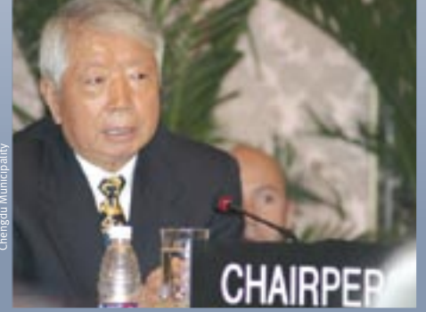
معالي وانغ كسوكسيان (الصين) رئيس اللجنة في دورتها الاستثنائية الأولى بشنغدو

Culture Department of Chengde Municipality