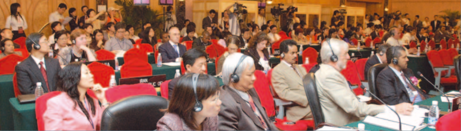
Le Comité intergouvernemental lors de l'ouverture de sa première session extraordinaire à Chengdu, Chine.

(suite) Le Comité a également décidé qu'un emblème était nécessaire pour soutenir et promouvoir la Convention. Un logo confèrera à la Convention plus de visibilité – à l'instar d'autres conventions et programmes de l'UNESCO. À la prochaine session du Comité, à Tokyo, un groupe de travail sera probablement constitué afin d'organiser un concours public pour la conception de cet emblème. Nous en reparlerons dans le prochain numéro du Messenger .