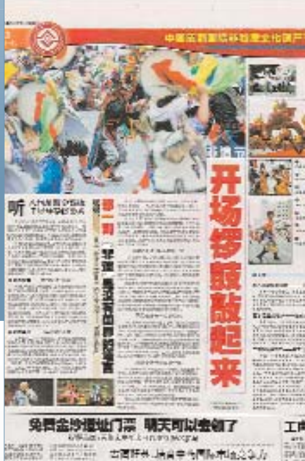
Материалы в местной прессе, посвященные первому Фестивалю нематериального культурного наследия

Работа Комитета над процессом номинирования и внесения в списки не прекратится после утверждения критериев. В сентябре 2007 г., на 2-й сессии в Токио, Комитет обсудит проект оперативных руководств, определяющих процедуры, подлежащие соблюдению, график подготовки и рассмотрения заявок, а также форматы, которые должны использовать заявители. Оперативные руководства, куда входят критерии, принятые в Чэнду, будут представлены на 2-й сессии Генеральной ассамблеи в июне 2008 г.