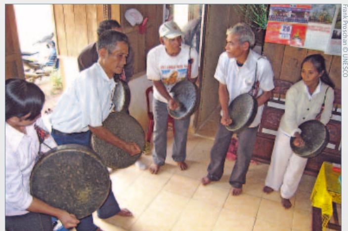
Viet Nam: El espacio de la cultura de los gongs

Una vez más el Comité expresó la especial importancia del Artículo 18 de la Convención, que contempla la elección y la promoción por parte del Comité de las mejores prácticas de salvaguardia. Hizo hincapié en que, en la implantación de este artículo, debería prestarse especial atención a los Estados en vías de desarrollo y a la colaboración Sur-Sur y Norte-Sur-Sur. El Comité espera promover y divulgar las actividades consideradas fundamentales para despertar la conciencia de la importancia del patrimonio inmaterial, en términos generales, y de la promoción de su salvaguardia. En el debate sobre el destino del Fondo del Patrimonio Inmaterial, el Comité tuvo en cuenta la asistencia preparatoria que podría ofrecerse a los Estados Partes que preparen las propuestas inherentes a este artículo así como la posible financiación de los proyectos y programas seleccionados. El Comité redactó un borrador de una serie concreta de directrices operativas que, una vez aprobada por la Asamblea General, servirán de pautas para la implantación de esta importante actividad.