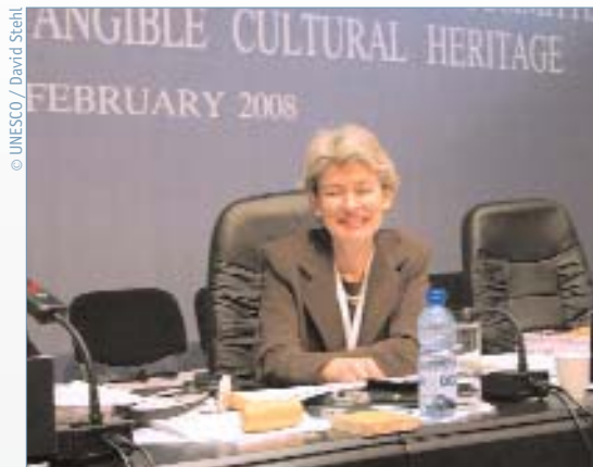
Ее Превосходительство г-жа Ирина Бокова (Болгария) председательствует на 2-й внеочередной сессии МК в Софии

На сессии в Софии МК еще раз подтвердил свое видение первоочередных целей Конвенции, которые заключаются в сохранении наследия путем налаживания партнерских отношений с носителями и практиками традиций и для их блага. По этой причине Комитет всегда придавал большое значение Списку нематериального культурного наследия, нуждающегося в срочной охране, а также отбору и содействию мероприятиям по охране, наилучшим образом отражающим цели Конвенции.