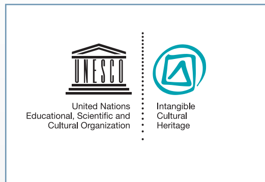
Эмблема Конвенции 2003 г., автор Драгутин Дадо Ковачевич

Конкурс на лучший дизайн эмблемы был объявлен в октябре 2007 г. и завершился 17 марта 2008 г. Он был открыт для всех профессионалов-графиков, художников и тех, кто занимается нематериальным наследием. За проведением конкурса наблюдал избранный Комитетом специальный вспомогательный орган, состоявший из представителей Франции (Шериф Хазнадар, председатель),