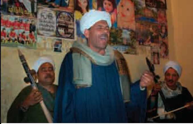
ملحمة السيرة الهلالية، مصر

ومن أجل صون التراث الثقافي غير المادي، نحن بحاجة إلى اتخاذ تدابير تختلف عن تلك التي استخدمت من أجل حفظ المعالم التاريخية والمواقع والأماكن الطبيعية. فمن أجل الإبقاء على التراث غير المادي حياً، يجب أن يظل جزءاً لا يتجزأ من ثقافة ما وأن يمارس ويُعلم بانتظام في المجتمعات المحلية وبين الأجيال. هذا وإن المجتمعات والجماعات التي تمارس هذه التقاليد والعادات في كل مكان في العالم لديها أنظمتها الخاصة لنقل معارفها ومهاراتها، وعادة ما تعتمد على النقل الشفهي بدلاً من النصوص المكتوبة. ومن ثم لا يمكن صون أنشطة التراث غير المادي بمعزل عن المجتمعات المحلية والجماعات والأفراد الذين يحملون مثل هذا التراث.