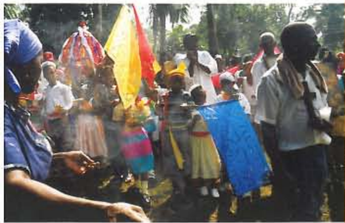
⊗ Không gian Văn hóa Villa Mella, Cộng hòa Dominican

Bản thân các cộng đồng cũng tham gia vào quá trình xác định và định nghĩa di sản văn hóa phi vật thể: họ là những người quyết định các tập quán và yếu tố nào là di sản văn hóa của họ.