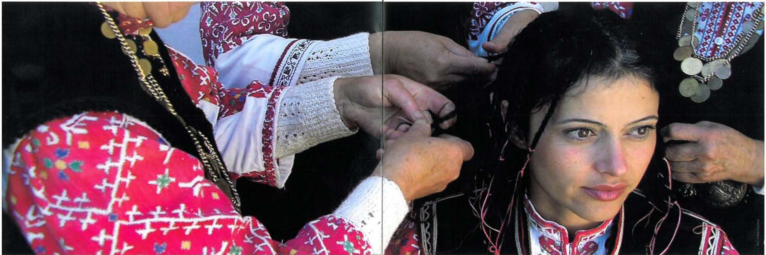
📍 Nghệ thuật âm nhạc phức điệu, vũ điệu và nghi lễ ở vùng Shoplounk, Bulgaria