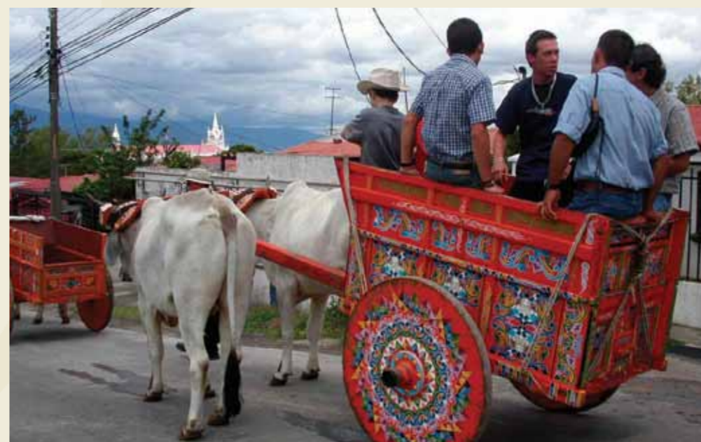
Ta'anga © Ministerio de Cultura, Juventud y Deportes