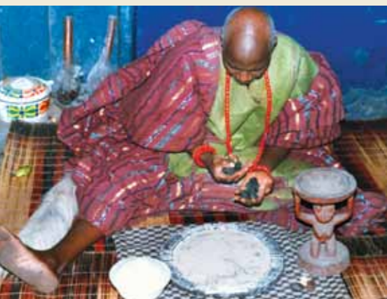
Ta'anga © Wande Abimbola