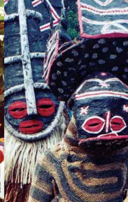
Ta'ānga © Comisión Nacional Zambiana para la UNESCO