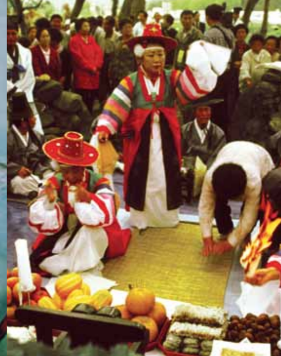
Ta'ānga © Kim Jong-Dal