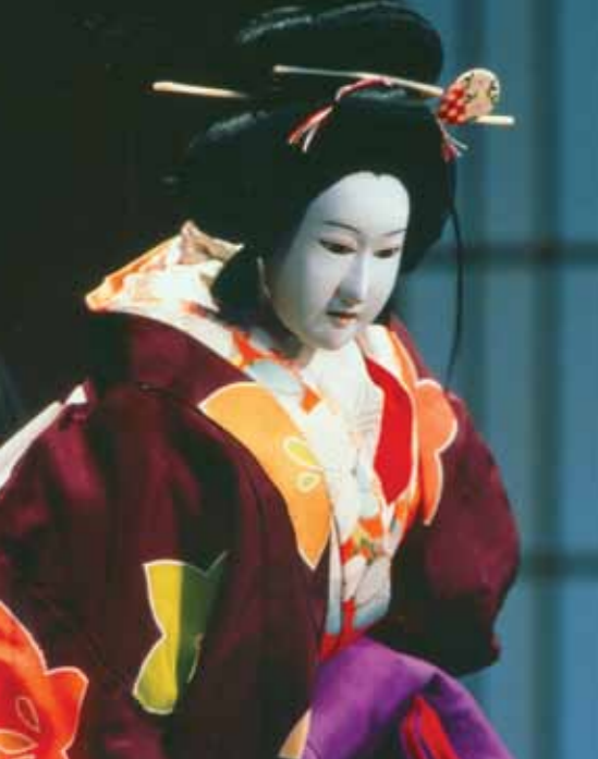
Ta'anga © Agencia para Asuntos Culturales/ADN Shriji