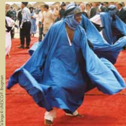
Ta'ãnga © UNESCO/F. Brugman

Ohechakuaávo komunida, ypykuéra, upéicha avei ambue aty ha tapicha peteítei ojapoha oipysyrõ, oñangareko