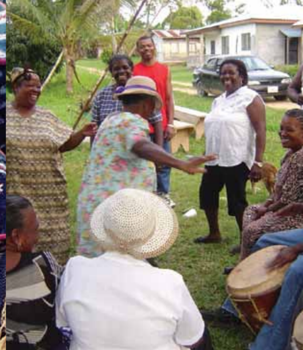
Ta'ānga © Consejo Nacional Garífuna