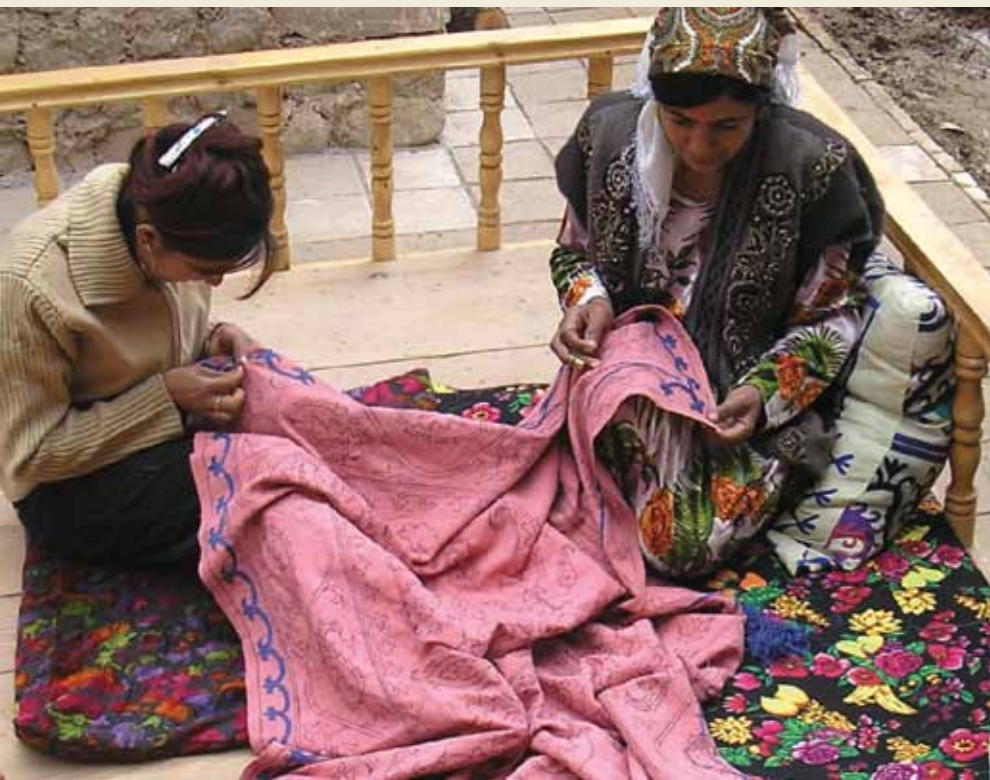
Ta'anga © UNESCO

orekóva tetānguére yvypóra derécho rehegua ha tembiapoukapyrā oíva oñemomba'epotávo komunida, aty, tapicha peteitei ha ñakārapu'ā porā.