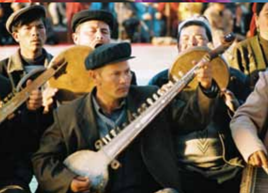
Ta'anga © Fernando Brugman / UNESCO