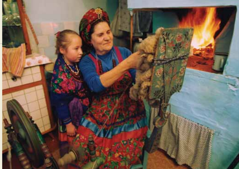
Ta'ānga © Casa Estatal Rusa de la Creatividad del Pueblo, Ministerio de Cultura

☞☞☞☞ Garifuna ñe'ë, ijeroky ha ipurahéi (Honduras, Belice, Guatemala y Nicaragua)