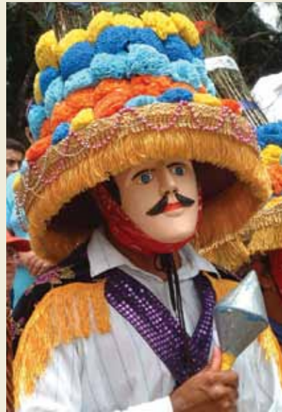
El Gūegūense, Nicaragua