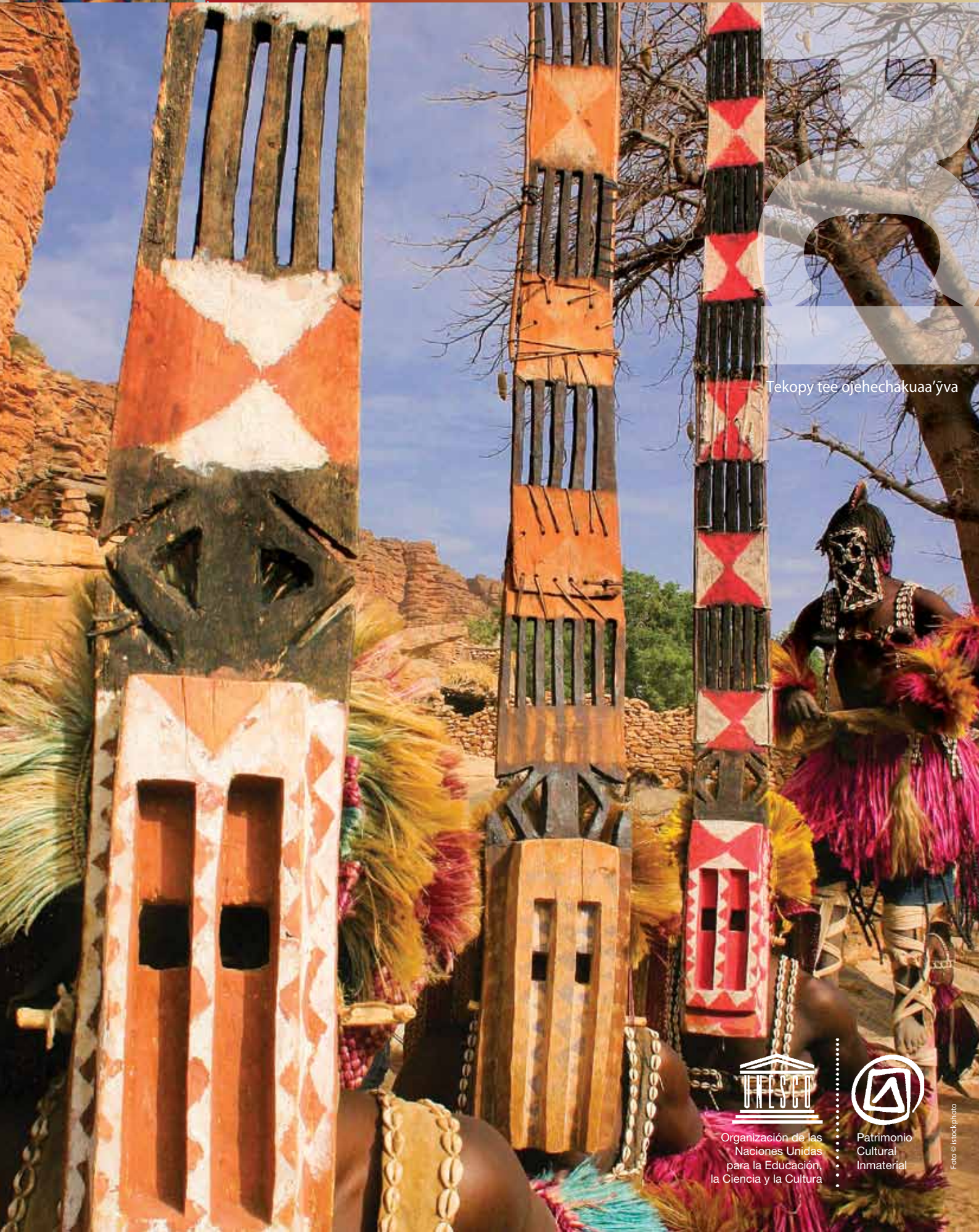
Tekopy tee ojehechakuaa'ýva