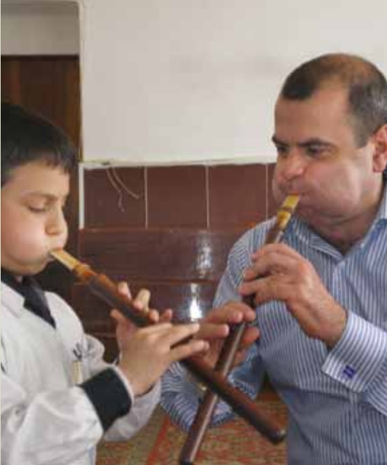
👉 El duduk y su música (Armenia) 👉 El carnaval de Oruro (Estado Plurinacional de Bolivia) 👉👉 El gbofe de Afunkaha: la música de las trompas traveseras de la comunidad tagbana (Côte d'Ivoire) 👉👉👉 El carnaval de Binche (Bélgica) 👉👉👉👉 El teatro de marionetas siciliano Opera dei Pupi (Italia)