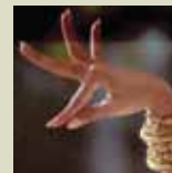
Taqinina Waqaychata Aphalla Yänaka

yänakaru yanapañatakixa janiwa wakisiriki. Uka aski yänakaxa yaqha yaqha uñstiri, mayja thakhinakani ukhamawa. Ukhamäpanxa, patrimonio cultural inmaterial taqi jani uñjkaya jani llamkht'kaya yänakaxa ayllunkirinakana uñstayatapanxa jaqinakapana jakayataskiwa, jupanakarakiwa thuqhuñanakapampi chika, jaylliñanakapampi chika, qullasiñanakapampi chika sarantayaskapxi, jani ukhamkaspa ukjaxa niyasa mayjt'awayxaspawa. Ukhamarusa, ayllupana jakasirinakapaxa, patrimonio cultural inmaterial taqi jani uñjkaya jani llamkht'kaya yänaka jupanakawa niya taqpachani utt'ayasaxa jakayaskapxi, khitinkapunisa mä kunasa ukaxa janiwa sumpacha yatiñjakiti.