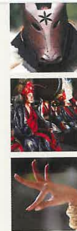
Immaterieel Cultureel Erfgoed