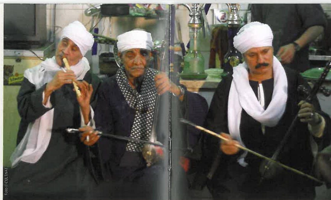
☉ Het Al-Sirah Al-Hilaliyyah epos, Egypte