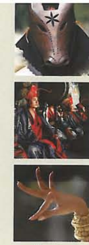
Di sản Văn hoá Phi vật thể

Công ước tập trung vào việc bảo tồn các di sản văn hoá phi vật thể - tức là đảm bảo di sản liên tục được tái tạo và truyền dạy bằng cách xác định bản thân di sản đó - chứ không tập trung vào việc sử dụng các công cụ pháp lý (ví dụ quyền sở hữu trí tuệ) để bảo vệ các biểu hiện cụ thể của di sản, bởi công việc này chủ yếu thuộc trách nhiệm của Tổ chức Sở hữu Trí tuệ Quốc tế. Tuy nhiên trong Điều 3, Công ước cũng nêu rõ rằng các