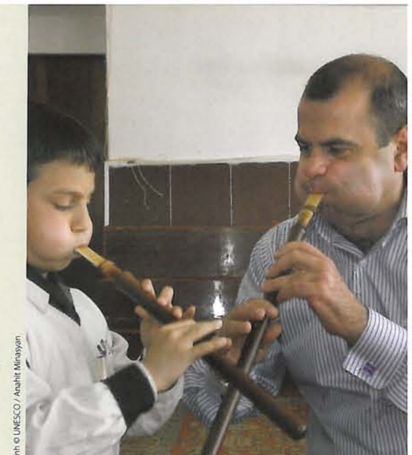
🌀 Kèn Duduk, Armenia