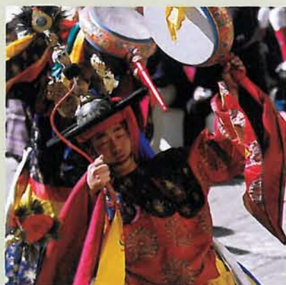
↳ Múa mặt nạ và trống của cộng đồng Drametse, Bhutan