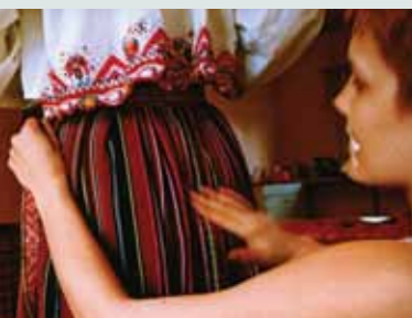
Ta'anga © Marc Sosaar

Kris Indonesia -gua ningo tembiporu ojeporúva árama ha ñembo'eráramo, ha oihe'íva ipokatueteremiha. Empu téra monandihára ombosako'í mba'erogue opaichagua kuarepotígui. Umi empu ningo artesano rá'evéhina, avei ikatupyry ñe'ë porãhaipyre, tekoasa ha ambueve mba'épe. Upe tendápe jepémo ojejuhu gueteri empus omoheñoiva imba'ekuaa, ha ojapóva kris yma guare iporãitemiva, ko'ë ko'ë re imbovyve ohóvo hikuía, ha ndojuhuvéi mitãpyahu ombohava'éva'erã ko'ã apokuaápe, ha péicha rupi ikangy ohóvo.