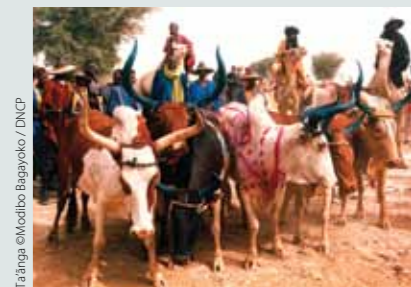
Ta'anga © Modibo Bagayoko / DNCP