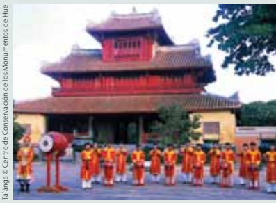
Ta'anga © Centro de Conservación de los Monumentos de Huế