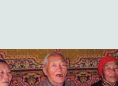
Ta'anga © Sonom-éh Yundenbat