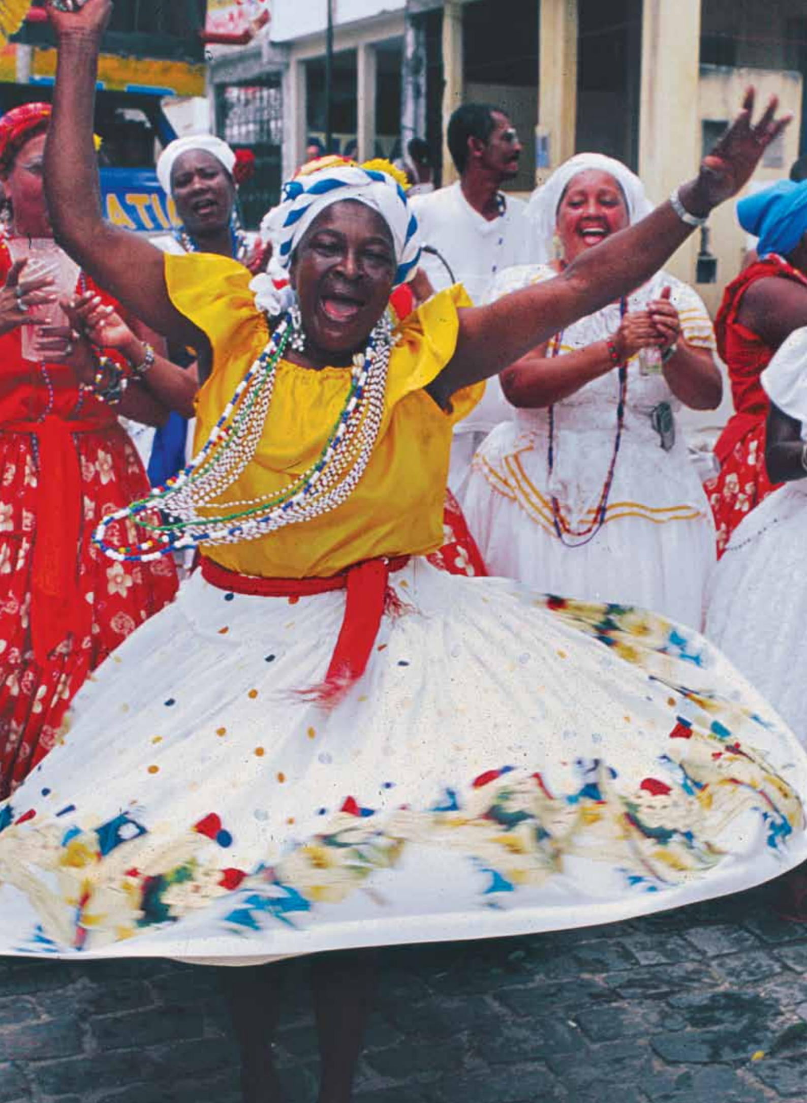
Ta'anga © Luiz Sáenz / UNESCO

pypekuéra ohecharamo ha oiporúva. Tuicha mba'e omoañetere opa tapicha oikóva aty téra sosiedápe reko, jámane oiporúramo aty háicha téra peteitei, ha oho ojopóre umi mba'e oikóvo ijapytekuéra ha tuicha mba'éva chupekuéra. Ha'ekuéra oipytyvõ ojehechauka ha'gua arajere, araka'épa oñehemityva'erã ha ñande yvypóra rekove jere; ojoaju hikuái tapichakuéra mba'eguerovia ha arapy hecha rehe, upéichante avei tekoasa ha komunida rapykuere rehe. Ko'ã teko ojehechakuaa heta hendáicha, ikatu aty michímimi téra mba'e ojuhuvá'ekue jegueromandu'a ha jegueovy'a tuicháva; opa ko'ã tenda oikoha hakáheta, katu oreko mba'e ombopeteiva chupekuéra.