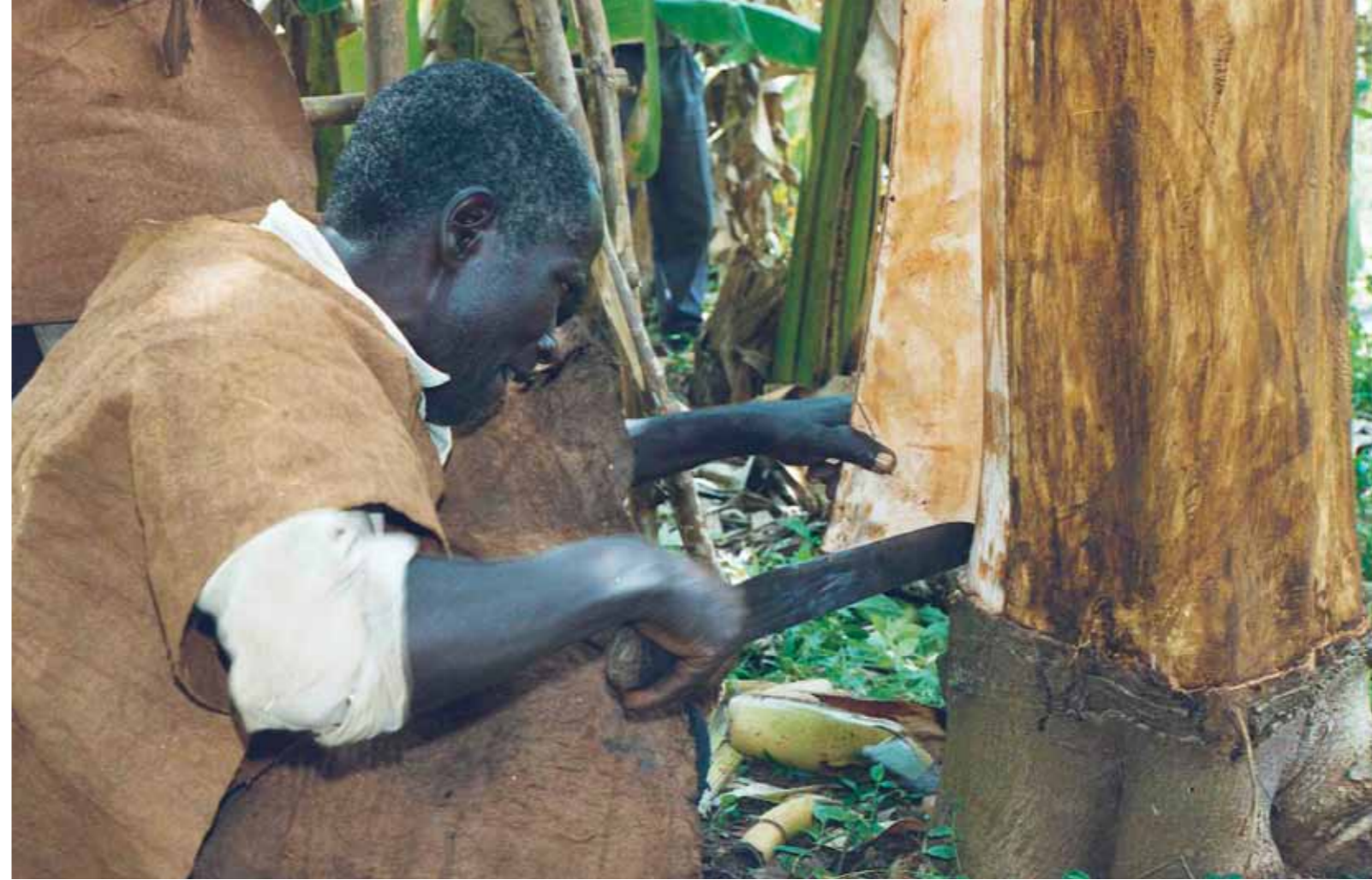
Ta'anga © J. K. Walusmbi

Amáke osẽ ohóvo tenonde ha iñambue hekópe sosiedakuéra ýrõ iñambue ohóvo tembikuaa arandu