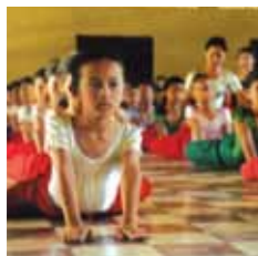
Ta'anga © Ministerio de Cultura y Bienes Artes