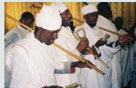
Ta'anga © UNESCO

oikove oñondive ha omoheñói mba'epyahu, ha péicha omongakuaa arte yvy ape ári, avei oguerukuaa heta apañuái. Hetaichagua pumbasy ikatu oñemopetei ikatu hañuáicha oñekuave'ë hekópe porã umi puraheirory. Péicha oikóramo heta purahéi, ja'eporásérõ ha'éva umi komunida korasósã, ikatu opyta ohóvo tapére ndorekoire pa'ü mamove.