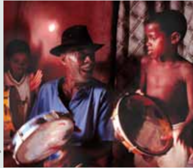
Ta'anga © Luiz Simoz / UNESCO

Samba de Roda del Recôncavo de Bahía (Brasil) ou umi tembiguái ojeporupyre Africa-gui jerokýgui, katu oreko hyepýpe avei Portugal reko, ha umíva ryepýpe iñe'ë ha ñe'ëpoty. Ko jeroky oíke avie samba ojejerokýva tavaháre, ha siglo XX-pe ktu oíke chugui Brasil reko tee rechauka añetete.