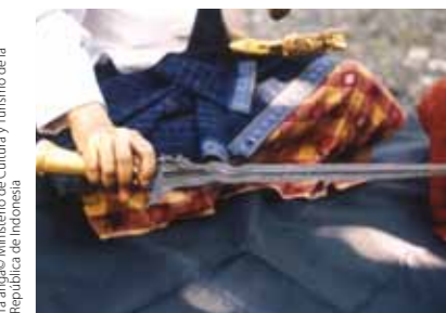
Ta'anga © Ministerio de Cultura y Turismo de la República de Indonesia