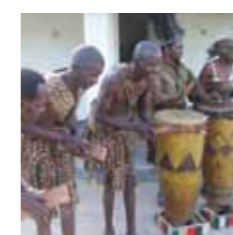
Ta'anga © UNESCO / Chimbichai Magfimo