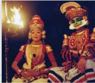
Ta'anga © Natanaelali / UNESCO

Ñoha'ãnga sánscrito Kutiyattam hína árte yma itujavéva India-pe ha ombyapu'a sánscrito yma ha Kerala reko yma guare. Ko pohá'ãnga tapicha oha'ãnga'apóva oiporu hova ha hesa omyasã ha ohechauka haġua máva ha'ekuéra orrepresentáva opensa ha oñandúva. Kutiyattam ojehechauka ymaite guive tenga oñeñembo'ehápe, ikatu tupão, ha péva oí peteí lámpara hendýva aséitepe ohechaukáva Tupãme.