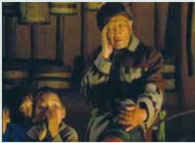
Ta'anga © UNESCO