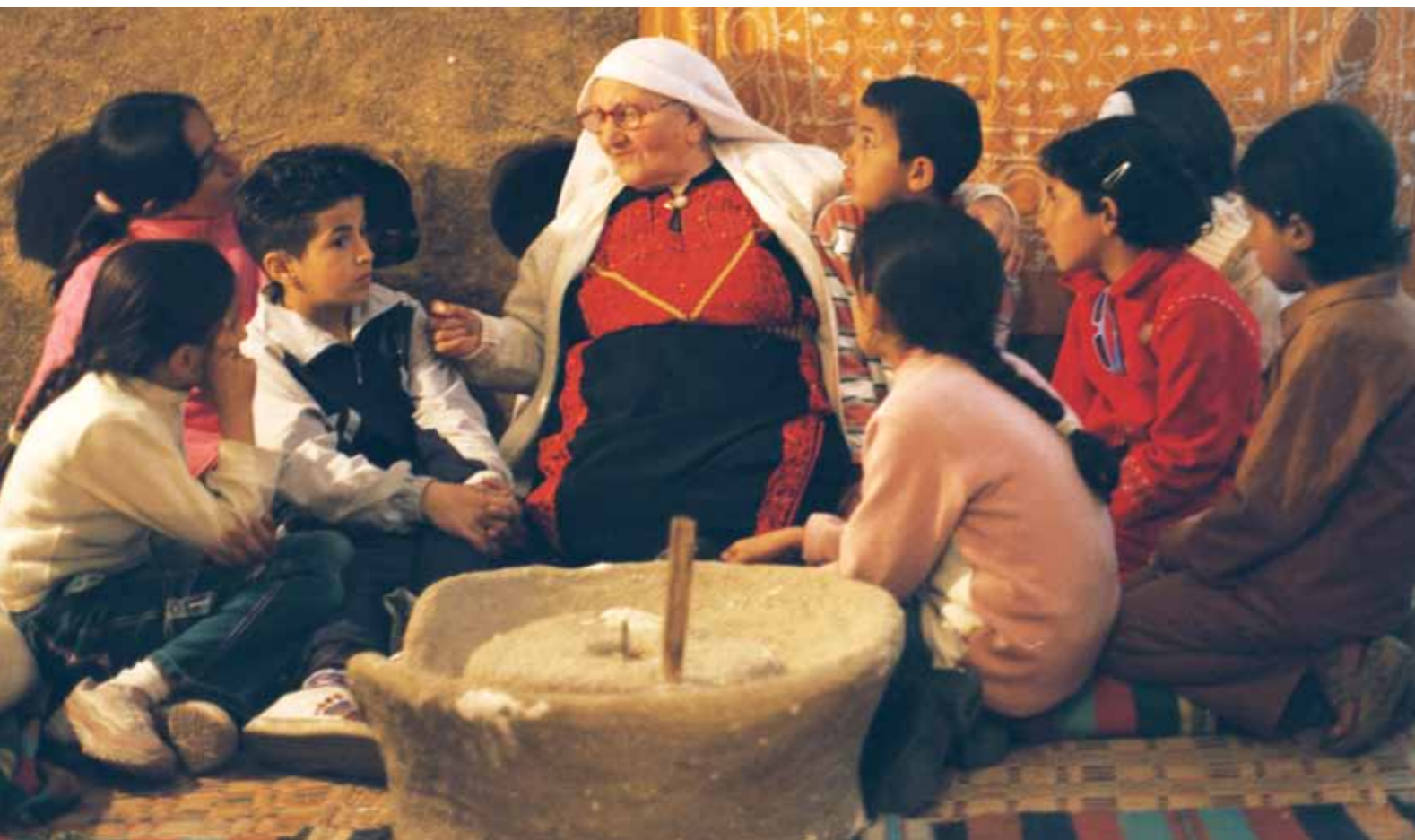
Ta'anga © MOC

Ko'ánga rupi heta arte de espectáculo ohasa tesapara. Amáke yvy tuichakue javeve ñanepeteimba ñande reko rupi, heta teko'yma ojeheja oje'hóvo; umi oñemomoráva tetãyguaquerá apytépe jepe oínte ouporáva chupe ha ambuekuérape katu ho'avaieterei.