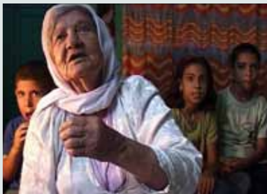
Ta'anga © Rafi Saifiah