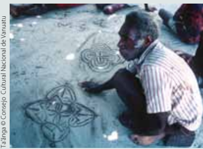
Ta'anga © Consejo Cultural Nacional de Vanuatu