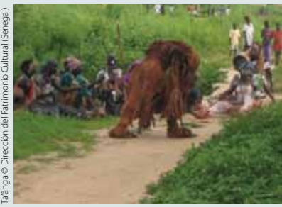
Ta'anga © Dirección del Patrimonio Cultural (Senegal)