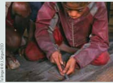
Ta'anga © J. Séguir/ZED