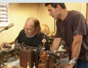
Ta'anga © J. J. Lecomte, Ministerio de Cultura de Francia

Uganda -pe ojepapo ñemonderã ka'avo yguégui, kóva ymaiteri guivéma ñane ramói ha ñande janyikuéra ojapo oúvo yya ape ári ko'ãgagua téla ojekuaa mbovyve. Ko téla ojeporuve ñembo'ehápe péicha ku oñemonguera hañua hasýva téra omanóva ñotý hápe ha avei tapichakuéra ijatyhápe omomorãvo heko; katu ojeporukuaa avei oñembosako'í hañua kortína, ñati'ujokoha, ao ojeke hañua ha mba'eñapytirã hamba'e. oikéu upe tetãme ao ojehekavakuéra oguerúva, koichagua téla opytaite nunga tesarápe, ha hendive avei jeroviapy ha ñembo'e ojeporuhápe; ko'ãga rupi imbaretejey ko mba'ekuaa.