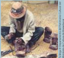
Ta'anga © Departamento de Patrimonio Cultural del Ministerio de Cultura de Madagascar