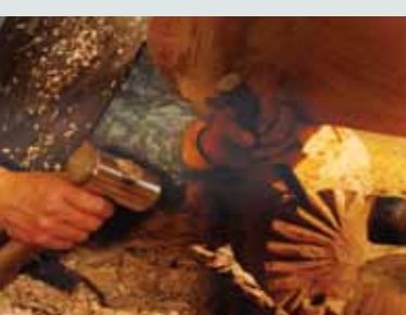
Ta'anga © Centro de Cultura Popular de Lituania

Francia -pe ojehechakuaa hetaiterei artesáno herakuãmombynývape hembiapokuéra oñeme'ë vo chupekuéra kuatia'atã "árte mbo'ehára"; ko'ã tapicha katupyry ombosako'í pojoapy ojeporúva mba'epuporãme, upéichante avei ao hamba'e. Péicha oñembohapse oñemyasáivo arandu ha mba'ekuaa ko'ã mba' rehegua.