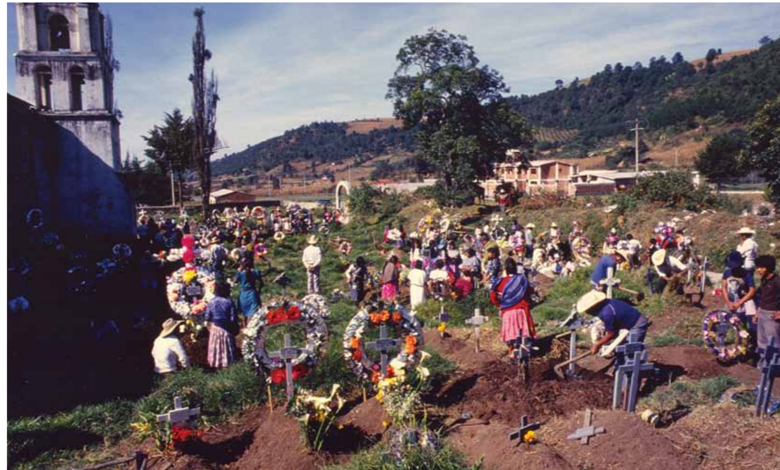
Ta'anga © Pedro Hilar / INI

Indígenakuéra vy'a omanovakuérape ġuarã, México