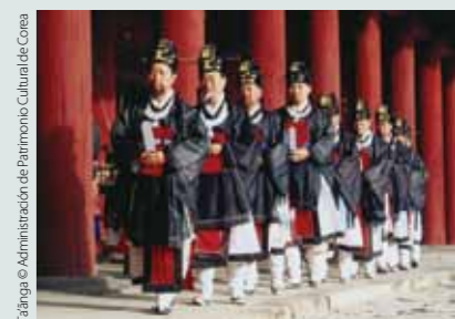
Ta'anga © Administración de Patrimonio Cultural de Corea

Ñembo'e ñemonguera rehegua ojekuaáva ojepapoitemíva okaháre Malawi-pe yvatévo, heñói siglo XIX mbytérupi ikatu hañuáicha ojeheja tesaráipe mba'embyasy, katu ramovévo noñemomba'e guasuvé yma guaréicha. Oñeñangareko potávo hese, ojeheka pytyvõ oñemokyre'y hañua mitãrusukuérape ko jeroky tesáirã rehegua, ha omokyre'y ñomongeta umi pohãnohára vimbuza ha entidad estado ha tetäyguá rehegua ohóvo pohãno rehe; ko'ávo ojepapo momaranduhára, taller marandurã ha festival rupi hamba'e.