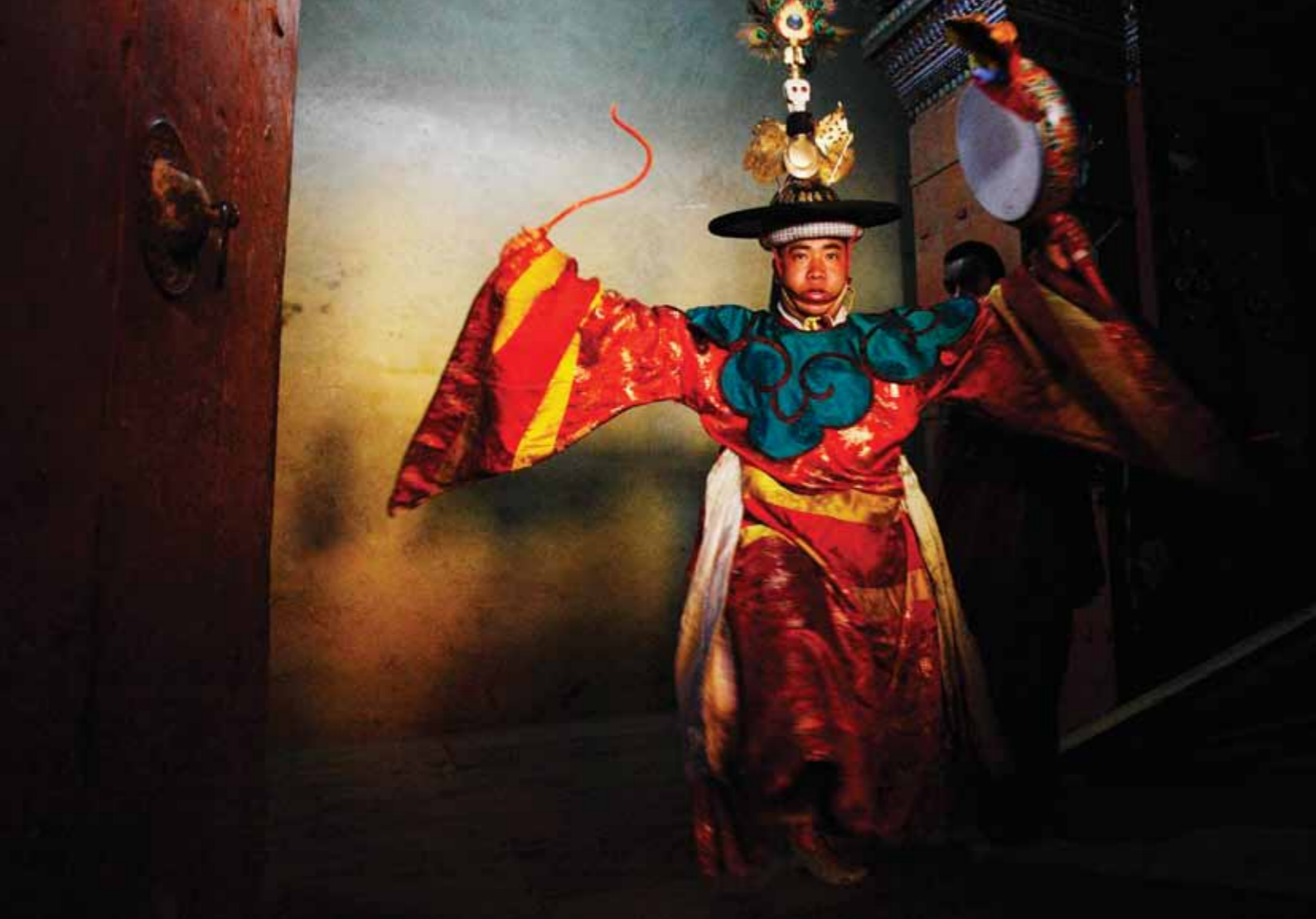
Ta'anga © Yoshi Shimizu/www.yoshi-shimizu.com