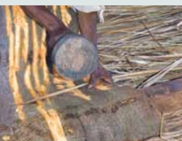
Ta'anga © J.K. Walusmbi

Kihnu (Estonia) rembikuaa rehehaukaha añetete hina umi ñemonderã ovecharaguégui ijapopyre ojapo ha omondéva kuñanguéra pe komundaygua. Kuñanguéra omba'apo hogapýpe ha oiporu tembiporu yma omoñanduti hañua ñemenderã: py ha po rehegua, polléra ha sái ombosa'y ha ombojeguáva imombe'upy he'iháicha.