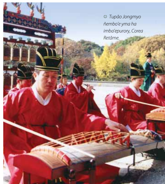
Tupã Jongmyo ñembo'e yma ha imba'epuroy, Corea Retãme.

Ambue mba'e ndetuicháva oñeñangareko potávo teko yma ha arte de espectáculo hína oñemongakuaa tembiporu oñemba'apo