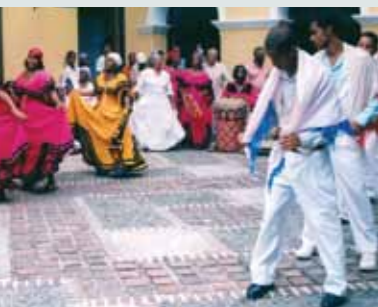
Ta'anga © Comisión Nacional Cubana de la UNESCO