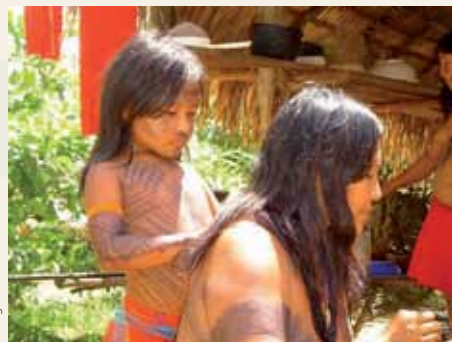
Ta'anga © UNESCO