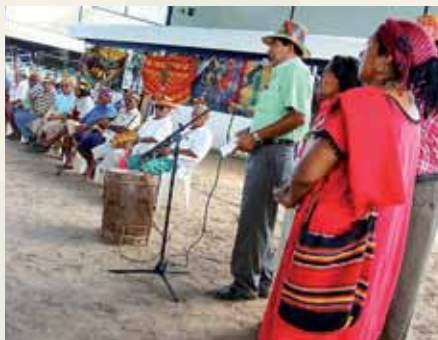
Ta'anga © UNESCO

Umi wayuus rekorã, oiporúva pūtchipũ'úi ("ñe'ëngatu") ©2009 Jayariyu-gui