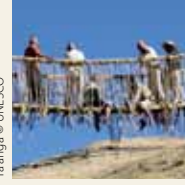
Ta'ãnga © UNESCO