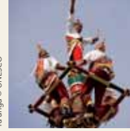
Ta'anga © UNESCO

Opa hendáicha ojejerokyháicha ko ñembo'e jeroky ojejapo oñemoingove jeyjávó arapy, ha péicha rupi ja'ekuaa ko'ã jeroky ohechauhaha mba'éichapa ha'ekuéra ohecha ko yvóra ha avei komunida mba'eporã, ha péva okomunika chupekuéra itupãnguéra ndive ha ohechauhaha akãrapu'ã rape. Opa tapicha oñemongu'eva ko jerokyrã ha mayma ohua'iva omironeávope ġuarã ko jeveve vy'a ha'ehína mba'eporã ha'ekuéra ijaguarávo hekopy tee ha hekokuéra rehe, ha upekuévo avei ohechauhaha hikuái omomba'eha ko'ã mokõi mba'e.