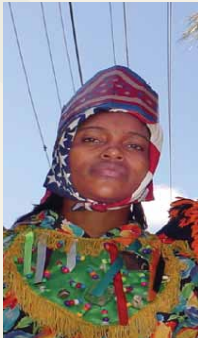
Ta'ãnga © UNESCO

oñe'ẽmbaite castellano añoite nunga, ha péva omoinge tesaparápe cocolo ñoha'ãnga jeroky. Ko'agaitéramo petei ñoha'ãngahára atymíntema oñemongu'e ombohasávo mitárusu pyahukuérape heko. UNESCO, umi komundaygua pytyvõme, ombosako'i petei tembiaporã guasu, jahechápa oipytyvõ oñemombarete jeývo ko'ã tapicha reko tee, ikatu haña'ũcha omyasái porãve hikuái ko hembikuaa, ojehecharamo chupekuéra ha ohupyty pytyvõ viru rupi.