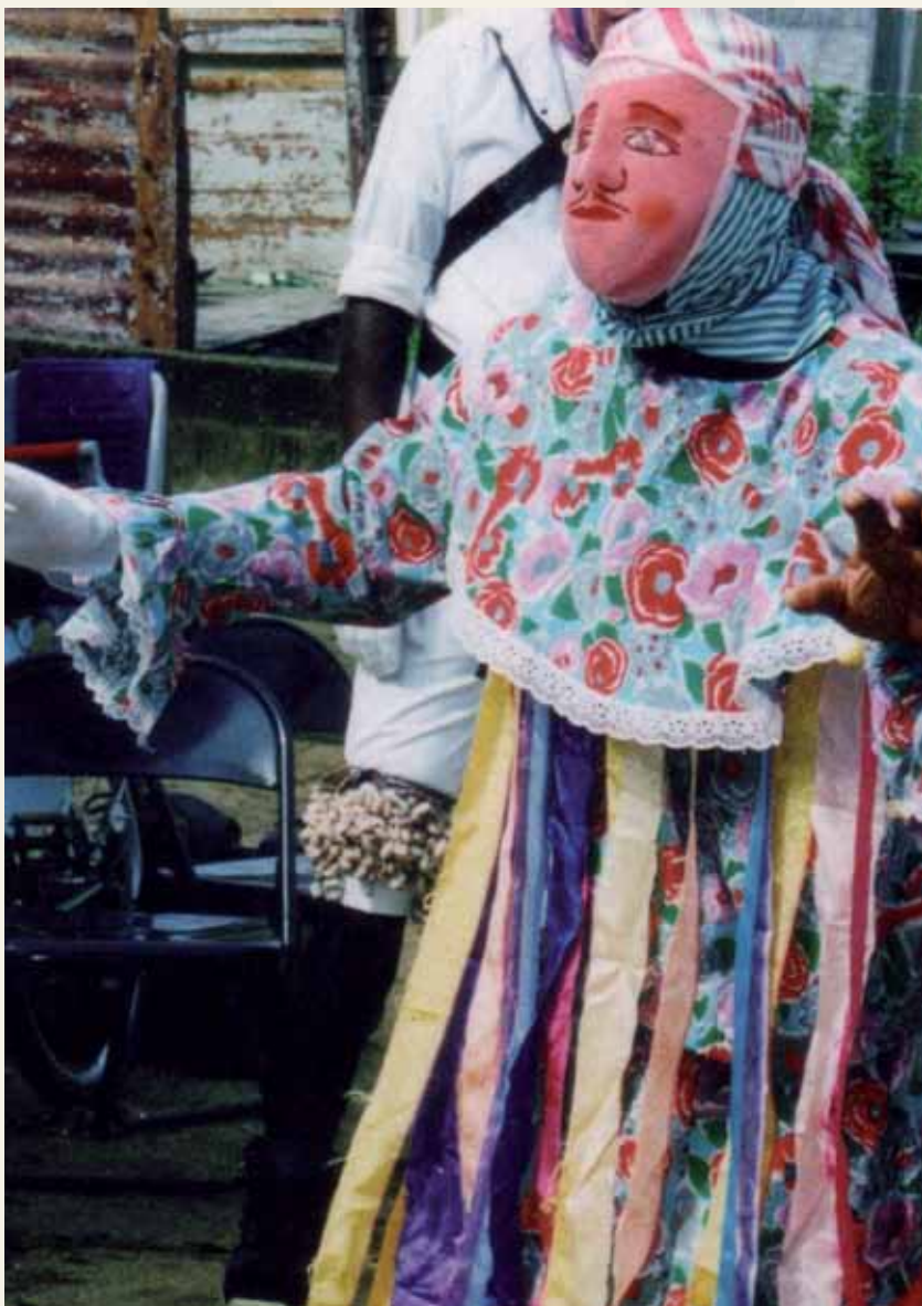
Ta'anga © UNESCO