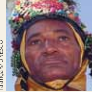
Ta'ãnga © UNESCO