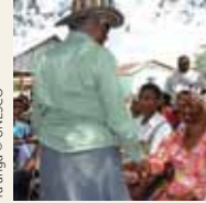
Ta'anga © UNESCO

Ombogue ha ombojevy hañua tembiapo vaicha oiporu hikuái heta símbolo, umivarã oiporu hikuái mbo'y itágui ijapopyre tērã ojuka vaka, ovecha ha kavara oikuave'ë jávo hembiaapo vaikuére. Umi mba'e ivaiivaivéva ojapova'ekue rehe ikatu oikuave'ë umichagua pojoapy, oñekuave'ëva ñembo'e pevarã ojejapóva oguata aja, ha oñehenói umi ogapy oñorairõva peguakuérape jahechápa ojevy ha oiko porã jey ojoapytépe hikuái.