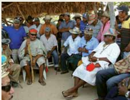
Ta'anga © UNESCO

Umi wayuus rekorã, oiporúva pūtchipũ'úi ("ñe'ëngatu") ©2009 Jayariyu-gui