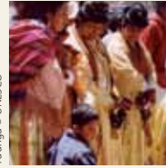
Ta'ãnga © UNESCO

Ojeporavopyre 2009-pe tembiapokue tekopy ojepokokuaa'ỹva rehegua iporãvévaramo