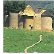
Immatoneel Cultureel Erfgoed

Er werd ook een gedragscode opgesteld in overeenstemming met de culturele regels van de Batammariba, speciaal voor toeristen, onderzoekers en filmmakers. Deze informatie over cultureel aangepast gedrag voor bezoekers is een belangrijk hulpmiddel voor de promotie van respectvol toerisme, zeker wanneer het gekoppeld wordt aan informatie over de rijkdom van het materieel en immaterieel erfgoed van de Batammariba.