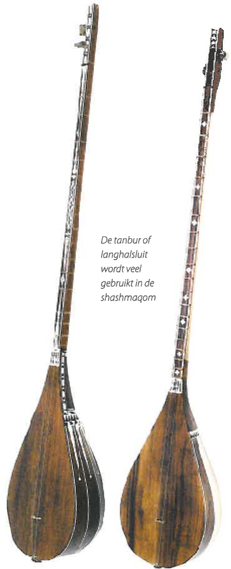
De tanbur of langhalsluit wordt veel gebruikt in de shashmaqom