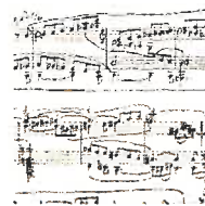
Immatériel Cultureel Erfgoed

instituut ( www.zti.hu , in het Hongaars en het Engels), bevatten meer dan 14.000 traditionele liederen en informatie hierover. Dit alles werd verzameld tussen 1896 en 1940 door Béla Bartók, Zoltán Kodály en hun medewerkers en opvolgers. Op dezelfde site vinden we ook de databank 'Musical Sound Publications' die nog eens 6.000 traditionele liederen en melodieën bevat die op vinylplaat, magneetfoon of een andere drager zijn verschenen tussen 1950 en 2000. In de zoekmachine van de databank werd bovendien een tool geïntegreerd waarmee bezoekers van de site gemakkelijk muziek e.d. uit hun eigen streek terugvinden en downloaden. Deze onlinedatabanken worden veel gebruikt door gemeenschappen die steeds vaker documentatie over vroegere muziektradities gebruiken in het onderwijs en in culturele programma's. In ruil daarvoor geven leden van de verschillende gemeenschappen nieuwe informatie over hedendaagse muzikale expressievormen.